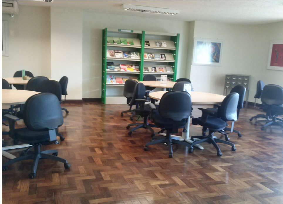
Figura 10 – Mesas de estudo