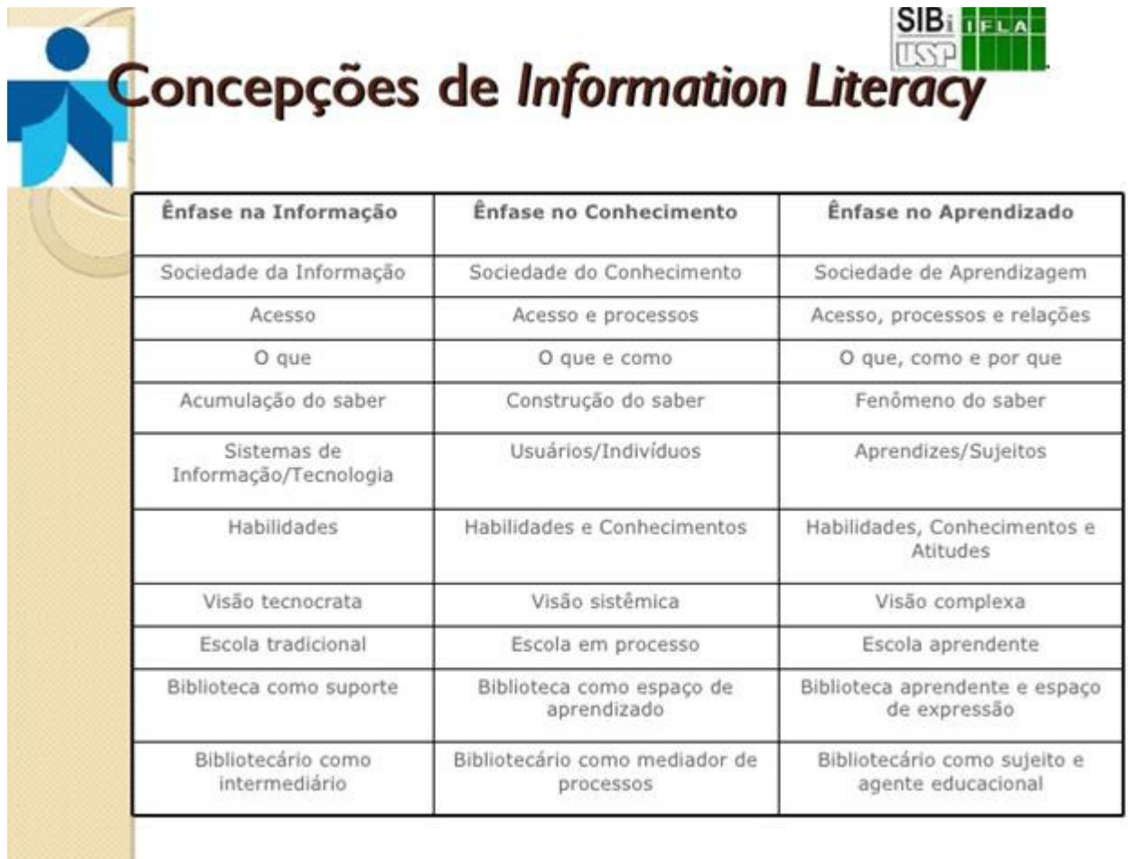
Figura 1 – Concepções de Information Literacy