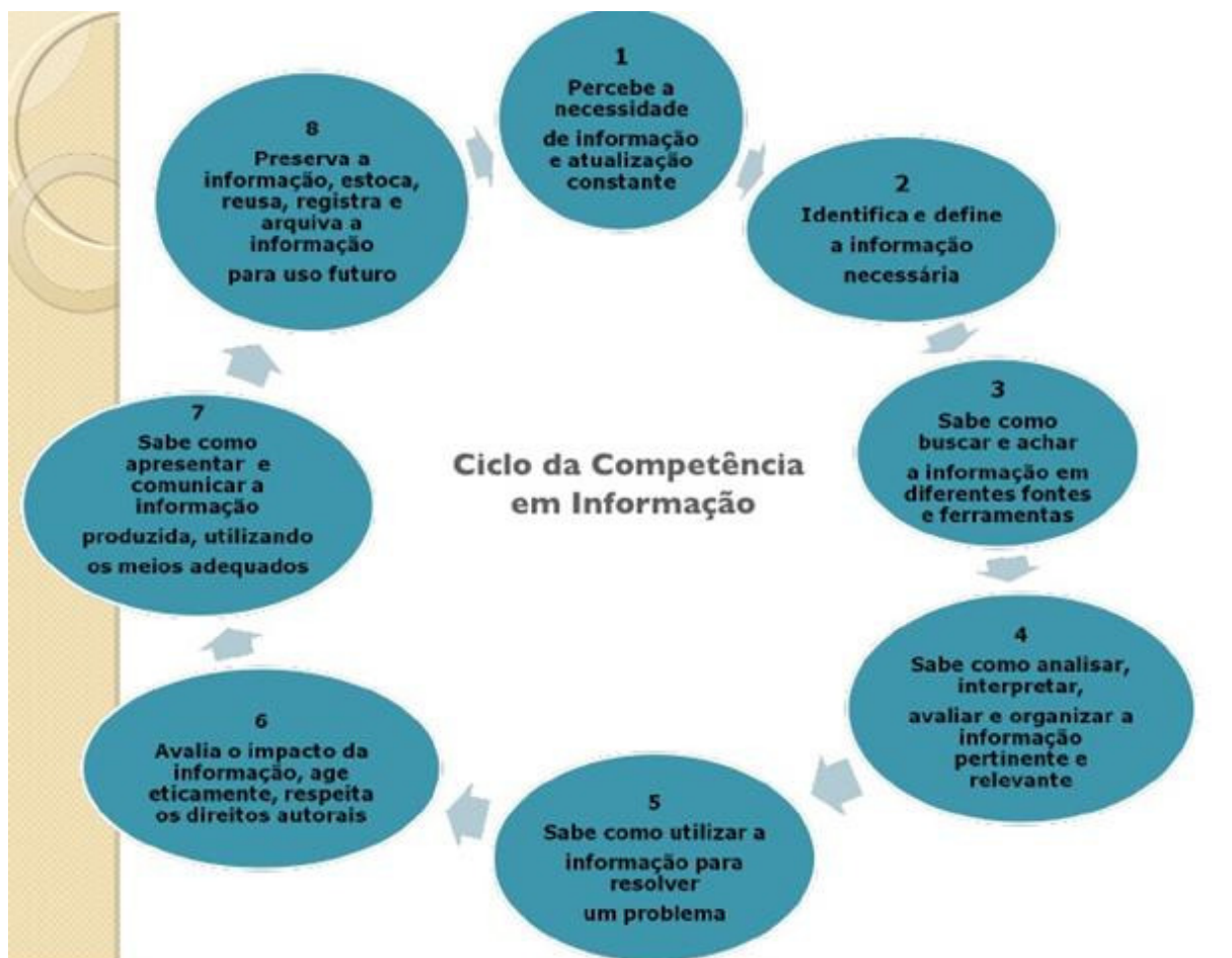
Figura 2 – Ciclo da Competência em Informação

Seguindo ainda a ideia de Dudziak (2009) sobre competência em informação, em uma aula, do “Curso de Capacitação para Bibliotecários do SIBi-USP – Training The Trainers in Information Literacy ”, a autora mencionou sobre o que as pessoas devem saber para serem competentes informacionalmente, afirmando que elas devem definir suas necessidades informacionais, saber como buscar e acessar a informação, como avaliá-la, organizá-la, transformá-la num amálgama de conhecimentos, habilidades e valores para, deste modo, aprender a aprender, de maneira independente, ao longo da vida. (DUDZIAK, 2009). A autora apresentou um Ciclo da Competência em Informação (Figura 2).