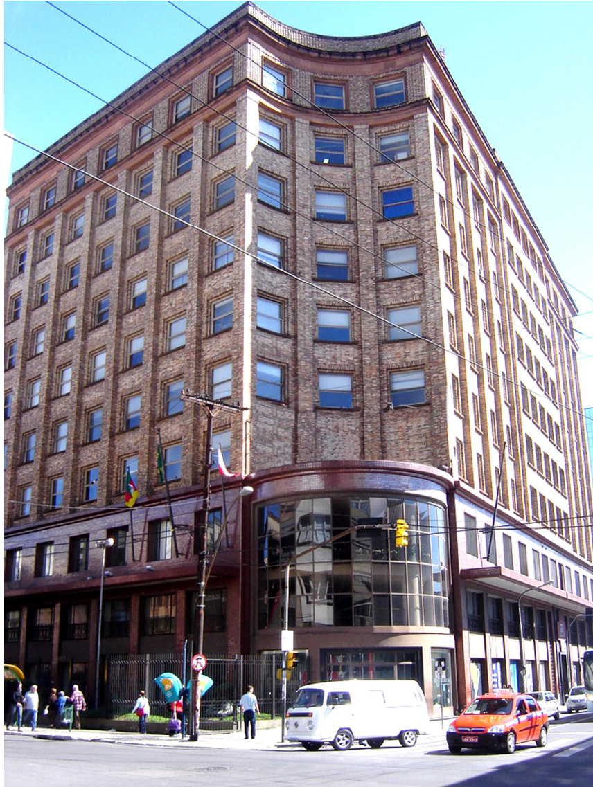
Figura 8 - Prédio do IFRS