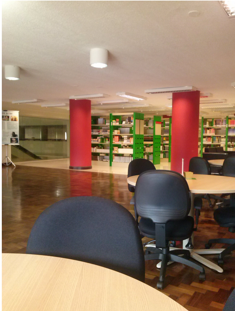
Figura 9 – Biblioteca IFRS

A seguir serão apresentadas algumas imagens mostrando a biblioteca (Figuras 9, 10 e 11).