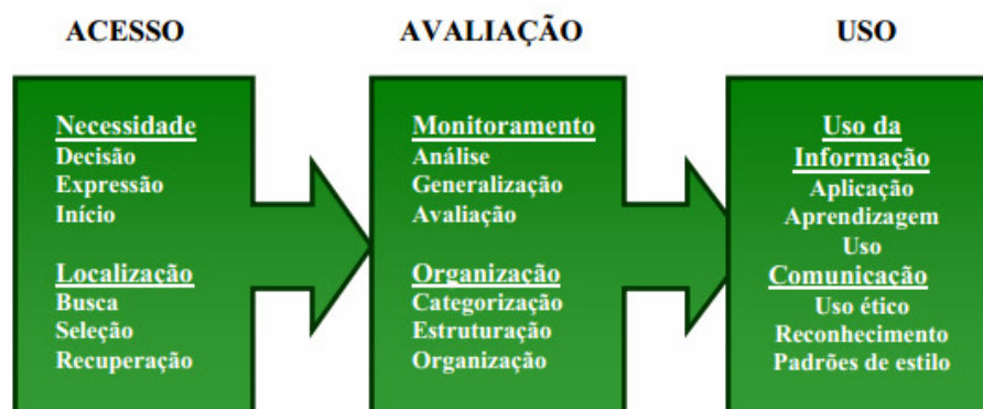
Figura 3 – Habilidades em Informação

Dentre outros padrões publicados, destaca-se o documento publicado em 2007, pela Seção de Habilidades em Informação da Federação Internacional de Associações e Instituições Bibliotecárias (IFLA) 2 que visa propiciar aos profissionais da informação uma base para implantar um programa de desenvolvimento de habilidades em informação. Para Lau (2008, p. 16) os padrões de desenvolvimento de habilidades em informação possuem três componentes básicos: acesso, avaliação e uso da informação (Figura 3).