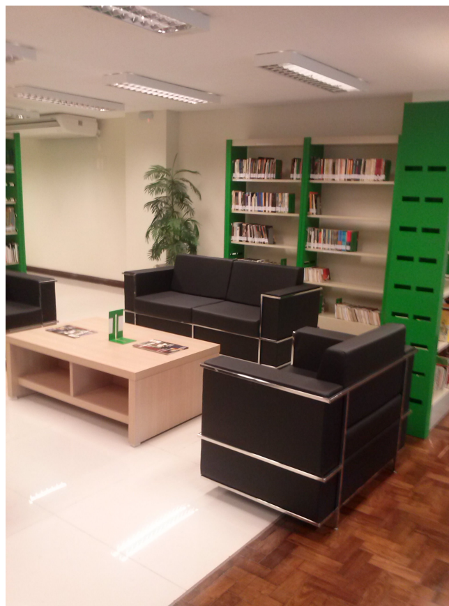
Figura 11 – Espaço na biblioteca