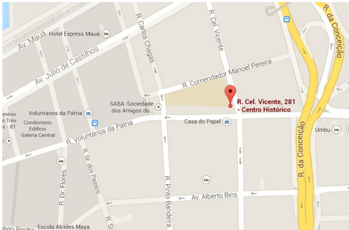
Figura 7 – Mapa do IFRS

O Câmpus de Porto Alegre do IFRS está localizado na Rua Coronel Vicente, 281, no bairro Centro Histórico, na cidade de Porto Alegre, capital do Estado do Rio Grande do Sul (Figuras 7 e 8).