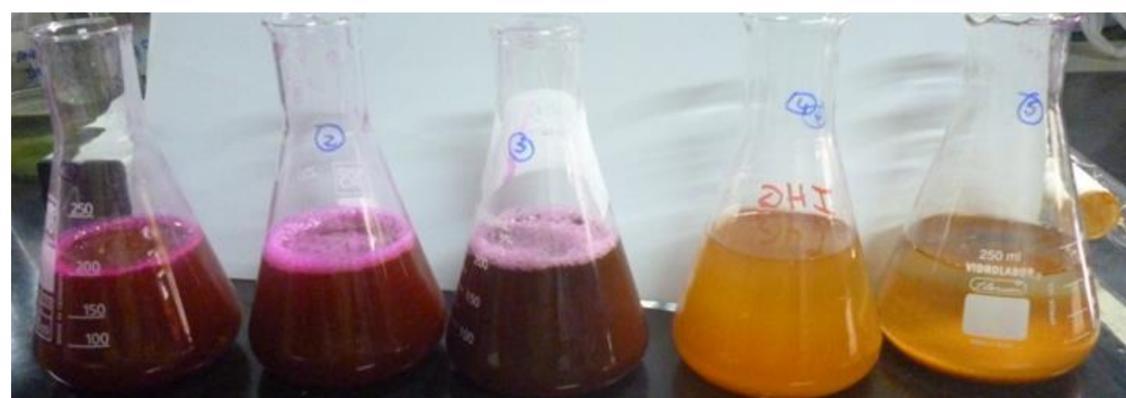
Figura 3 - Processo de tratamento do efluente contendo o corante Rodamina - B em escala de laboratório.

O efluente bruto e tratado foi analisado em relação a absorvância em 554 nm e a concentração de carbono orgânico total (COT).