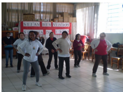
Atividades do Dia do Idoso - Lapa/PR