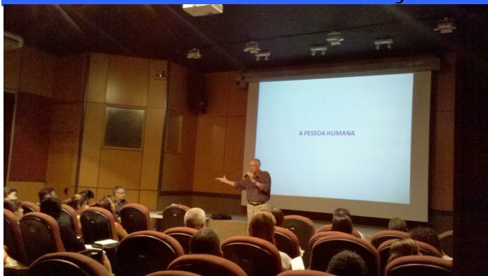
Secretário Nacional Afonso Barbosa

Foi realizada, em outubro, no auditório da 511 Norte uma palestra sobre Liderança ministrada pelo Secretário Nacional de Esporte, Lazer e Inclusão Social - Afonso Barbosa, que compartilhou no dia experiências e vivências dos seus escritos sobre liderança com uma visão nos tempos atuais.