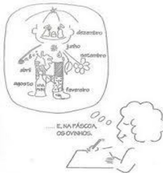
Figura 2: Planejamento Fonte: TONUCCI (1997, p.143).

Os saberes quando integrados as outras disciplinas possibilitam aos acadêmicos novas formas de pensar, conseqüentemente de organizar sua prática docente de forma mais integradora, como através da Pedagogia de Projetos exemplificada anteriormente.