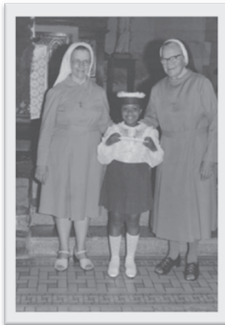
«A menina entre as freiras da escola, em trajes de formatura»

«Uma sorri, a outra observa. Cada uma olha para um lado. Dupla, oposta, igual, diferente. A da direita e a da esquerda, as duas de fralda, o cacho no alto da cabeça se repete na tentativa de tornar igual. A linha tênue do sofá separa uma da outra». As vidas quase imperceptíveis, que escapam das vidas docentes, ganham novos contornos nas narrativas visuais, “o punctum é o que é acrescentado à foto e que todavia já está lá” (BARTHES, 1984, p. 85).