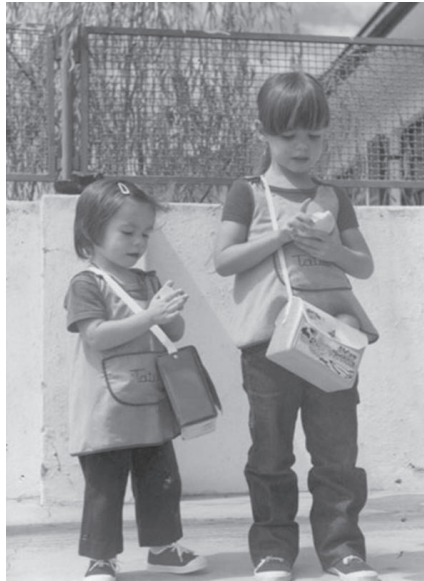
«As meninas na calçada»