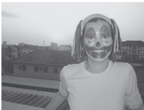
«Apesar do sorriso fascinante, um olhar preocupado... atrelado ao fundo nublado...»