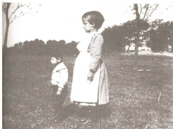
Lewis H. Hine. New Jersey, 1924.

Em A Câmara Clara , Roland Barthes apresenta sua leitura acerca dos punctums de algumas fotografias, acompanhada de breves enunciados. Sobre a fotografia acima, escreve o autor: “desprezo todo saber, toda cultura... Vejo apenas a imensa gola Danton do garoto, o curativo no dedo da menina...” (Barthes, 1984, p. 79).