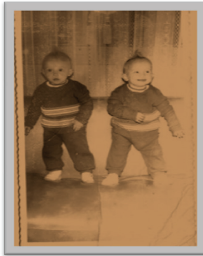
«As irmãs gêmeas surdas no sofá»

«Uma sorri, a outra observa. Cada uma olha para um lado. Dupla, oposta, igual, diferente. A da direita e a da esquerda, as duas de fralda, o cacho no alto da cabeça se repete na tentativa de tornar igual. A linha tênue do sofá separa uma da outra». As vidas quase imperceptíveis, que escapam das vidas docentes, ganham novos contornos nas narrativas visuais, “o punctum é o que é acrescentado à foto e que todavia já está lá” (BARTHES, 1984, p. 85).