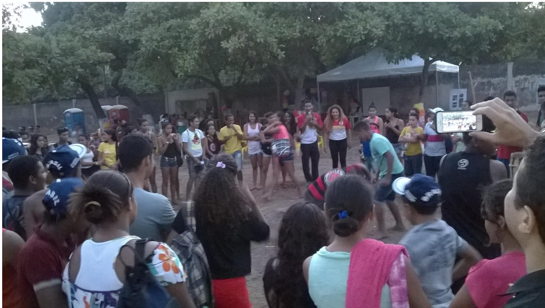
Roda de Capoeira Festival