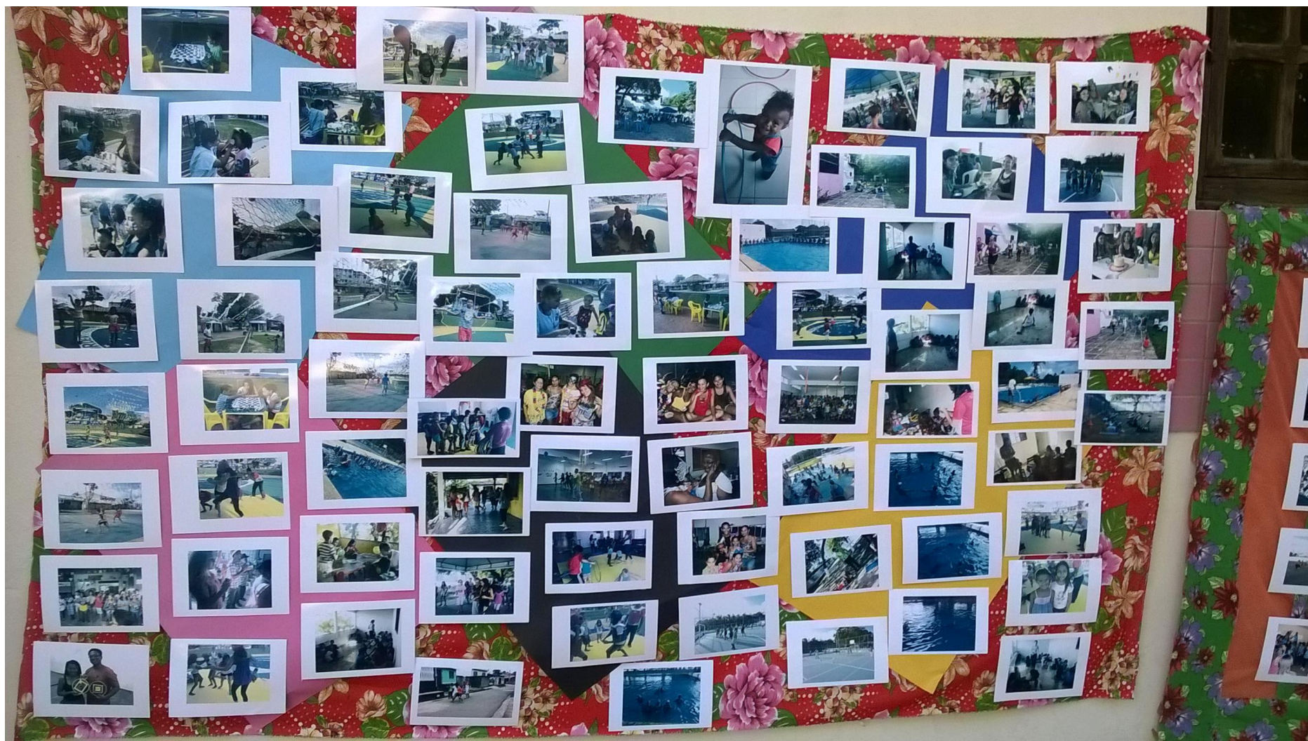
Relatório AV II e Festival Esportivo e Cultural - UFMA