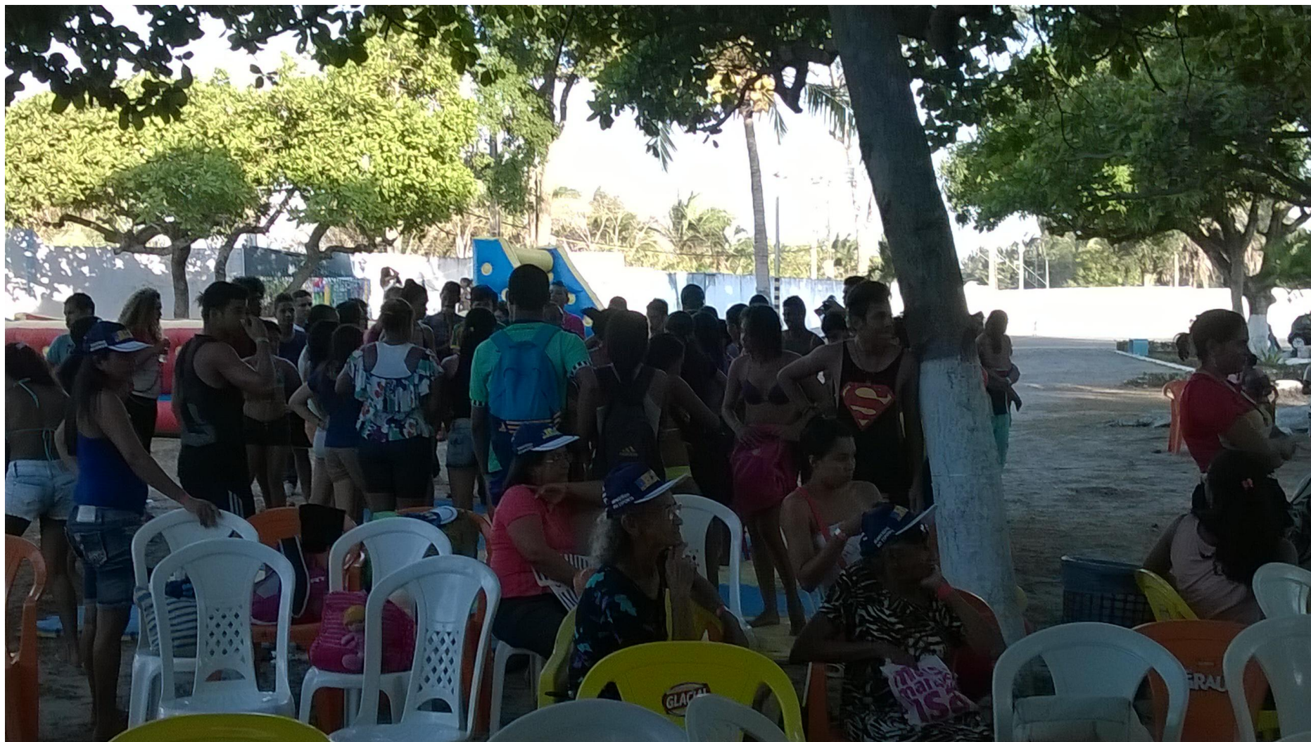
Relatório AV II e Festival Esportivo e Cultural - UFMA