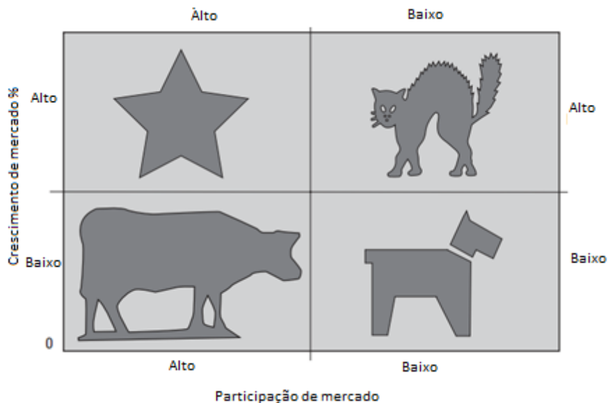
Figura 1: Matriz BCG - Crescimento/Participação

Desta forma, as unidades de negócio são classificadas e alocadas de acordo com cada quadrante, seguindo a seguinte classificação, exemplificada na Figura 1 (DAY et al. , 1982; LINNEMAN; THOMAS; 1982; KARLÖF; LÖVINGSSON; 2005; PROCTOR, 2008):