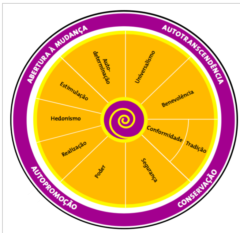
Figura 2 - Dimensões do Prof. Schwartz

Estas 11 dimensões gravitam entre polos opostos de Autotranscendência e Autopromoção, e Abertura à Mudança e Conservação. O primeiro polo compara o quanto o as questões que envolvem o indivíduo dizem respeito a si mesmo e sua família (Autopromoção) e à sua comunidade e o bem do próximo (Autotranscendência). Este índice está correlacionado com a dimensão Individualismo do Prof. Hofstede. O segundo polo diz respeito ao quanto o indivíduo se apega à tradições (Conservação) e aceita alterações na sua vida (Abertura à Mudança). Esta dimensão está correlacionada com a dimensão de Evasão de Incertezas do Prof. Hofstede. A dinâmica do prof. Schwartz está explicitada na figura 2.