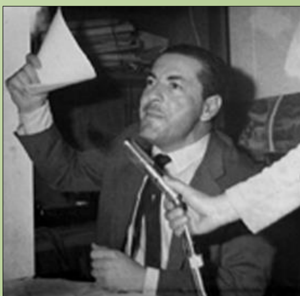
Leonel de Moura Brizola

O Brasil da primeira metade dos anos 1960 vivia um conturbado período de radicalizações políticas. Eleito em 1962, Leonel de Moura Brizola exercia o mandato de Deputado Federal pelo antigo estado da Guanabara quando se mostra decepcionado tanto com o funcionamento e a inoperância do Congresso, como também com o conservadorismo de alguns de seus colegas do Partido Trabalhista Brasileiro (PTB). Brizola vinha buscando uma série de reformas estruturais para o Brasil, quando decide então alargar seu campo de ação política, voltando-se para a mobilização popular. No fim de 1963, ampliada pelo alcance do rádio, a capacidade mobilizadora de Brizola faz surgir os Comandos Nacionalistas ou, como também ficaram conhecidos, os Grupos dos Onze Companheiros. A atuação dessas organizações gera controvérsia na historiografia, sendo consideradas tanto como grupos de pressão política, como também grupos guerrilheiros. Essa pesquisa faz parte do projeto A experiência democrática no Rio Grande do Sul e a radicalização do PTB na década de 1960 , coordenada pela professora Dra. Carla Brandalise da UFRGS em associação com a professora Dra. Marluza Harres da UNISINOS.