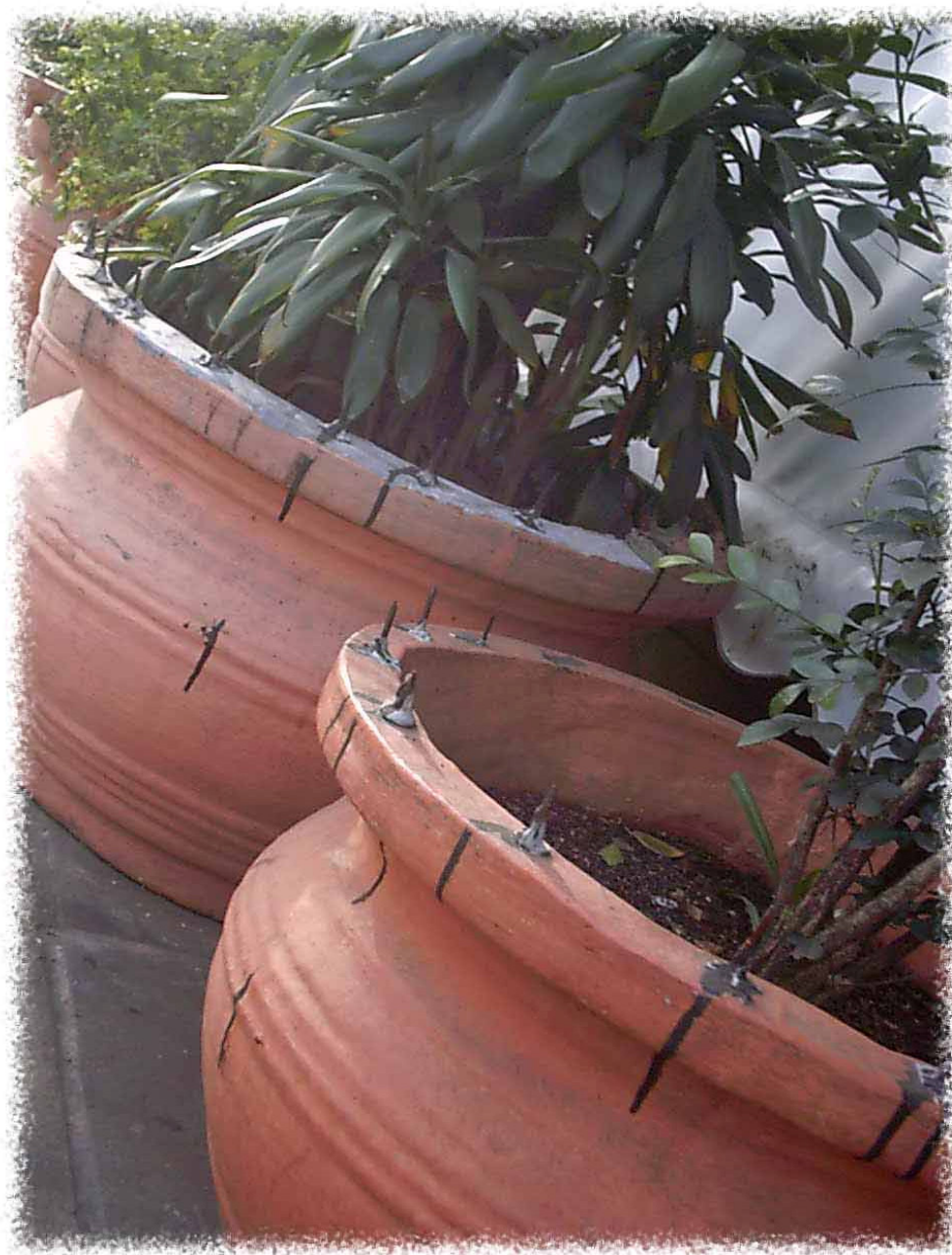
Figura 4: Proibido sentar!

Pode 'até' ser gay, mas tem que consumir! O Shopping e os 'incômodos' frequentadores.