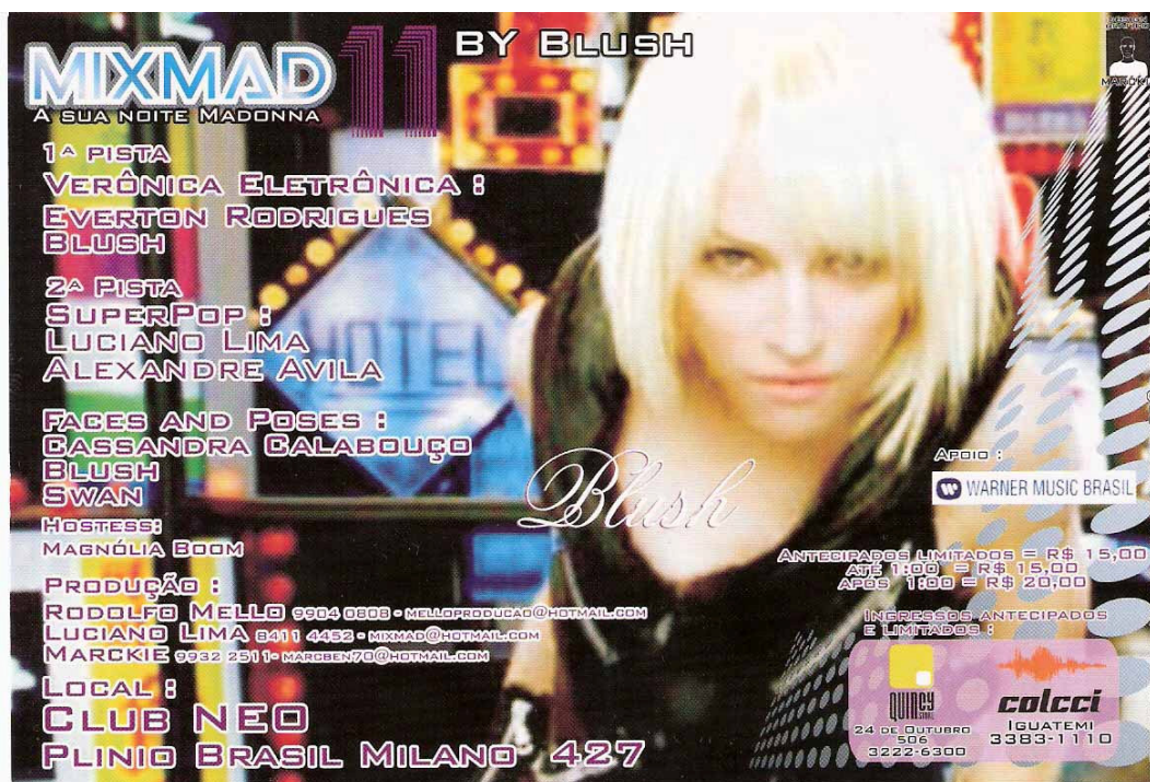
Figura 14: A sua noite Madonna

A cena selecionada para compor este flyer mostra, ao fundo, uma 'metrópole polifônica' (Canevacci, 2005): muitas luzes, profusão de cores, uma multiplicidade de formas e códigos, compondo, a meu ver, um convite a uma experiência plural,