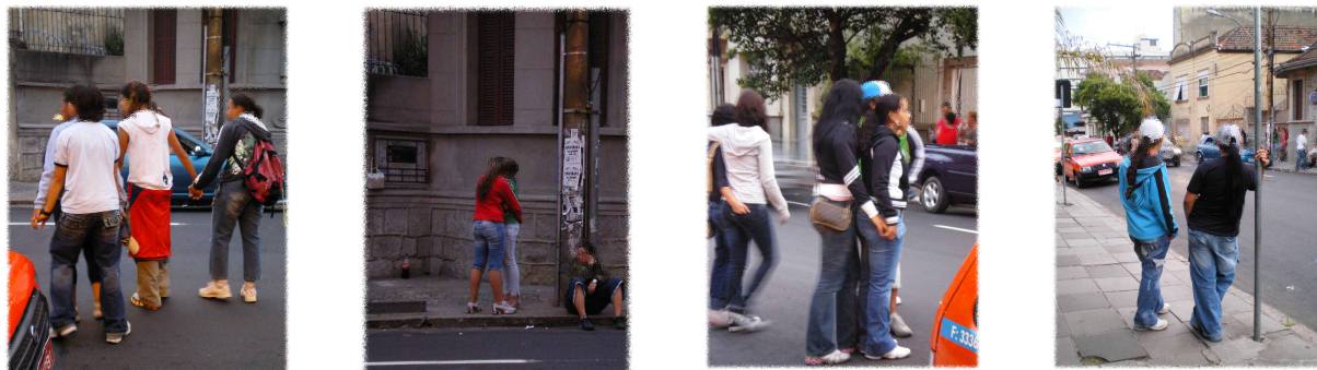
Figura 16: Sujeitos impensáveis?

necessário, buscar outras pedagogias para essa tarefa, como as pedagogias queer , que propõem tensionar os processos de construção do que é tomado como normal ou natural.