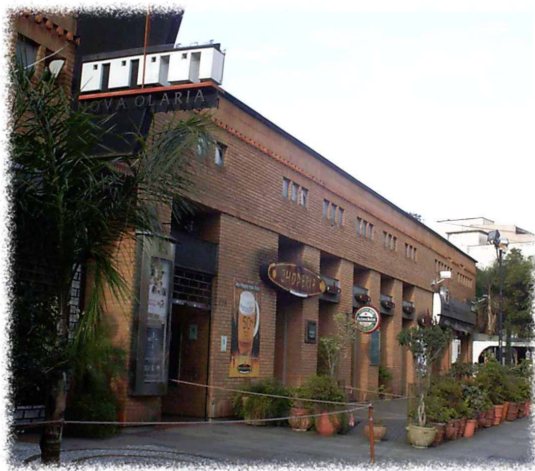
Figura 1: Shopping Nova Olaria , domingo, inverno de 2007.

Localizado no 'coração' do Bairro Cidade Baixa , o Shopping Nova Olaria reúne bares, restaurantes, lojas de vestuário, uma livraria e salas de cinema. O cinema é um dos pontos fortes do Shopping , com uma programação variada, considerada alternativa, pois, na maioria das vezes, exhibe produções fílmicas independentes ou filmes europeus, fora do circuito de produção estadunidense. Dentro do espaço destinado ao cinema encontra-se o Café Guion , com decoração temática voltada para o cinema. A livraria é ponto de encontro de intelectuais, estudantes e professores das diversas áreas do conhecimento. Quanto à gastronomia, o Shopping conta, inclusive, com uma casa de fondue e, no inverno, é possível ocupar as mesas na área externa, pois aquecedores presentes no local, lareira e velas criam, 'uma atmosfera europeia' ao lugar.