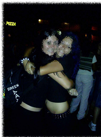
Figura 11: Aqui a gente pode ser o que é!

Trago essa comunidade trans-viada como um lugar outro, uma heterotopia homoafetiva, onde os jovens compartilham práticas afetivas, experimentações, sem os contratempos do mundo 'lá fora', onde cada um pode ser o que é. Na comunidade, é permitido 'cada um ser o que é'. Como é possível inferir, a partir da imagem anterior e do trecho extraído de uma conversa que tive com o jovem Alê, de 20 anos: