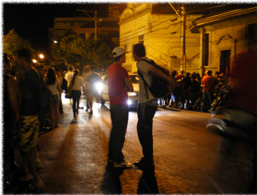
Figura 3: Jovens na cidade polifônica.

Essa prática da lugarização não é observada apenas nos arredores do Shopping Nova Olaria , outros tantos grupos juvenis lugarizam determinados pontos de Porto Alegre, como mostram os estudos de Garbin (2006), que abordam nomadismos e lugarizações juvenis na CCMQ (Casa de Cultura Mario Quintana), Arco da Redenção (Movimento ao Expedicionário do Parque Farroupilha) e o Rua da Praia Shopping , onde as mais variadas tribos juvenis transformam espaços em lugares, através das mais variadas práticas.