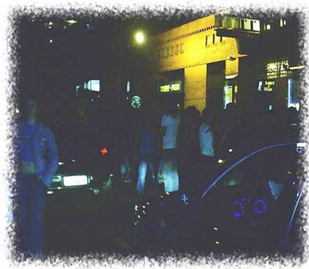
Figura 5: O lugar de vocês é lá na rua!

A expressão que busquei para nomear a imagem acima “ O lugar de vocês é lá na rua ” se refere à menção anteriormente citada dos administradores do Shopping . Como coloca Bauman (1999), a extensão ao longo da qual os que podem e os que não podem se situam, numa sociedade de consumo, é o seu grau de mobilidade – sua liberdade de escolher onde estar. Uma diferença entre os que podem e os que não podem é que aqueles podem deixar estes para trás, mas não o contrário. As cidades contemporâneas são locais de um “apartheid ao avesso” (BAUMAN, 1999, p.94): os que podem ter acesso a isso abandonam a sujeira e a pobreza das regiões em que estão presos aqueles que não têm como se mudar. Os que podem escolhem seus destinos de acordo com as alegrias que oferecem. Os que não podem volta e meia são expulsos do lugar em que gostariam de ficar. Se