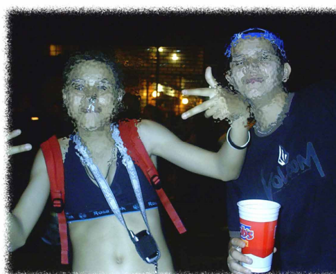
Figura 7: Aqui a gente vê e é visto!

Escolhi o título “Aqui a gente vê e é visto!” para esta montagem de imagens, por sugerir, dentre os jovens, o gosto pela visibilidade, pela extravagância, pela