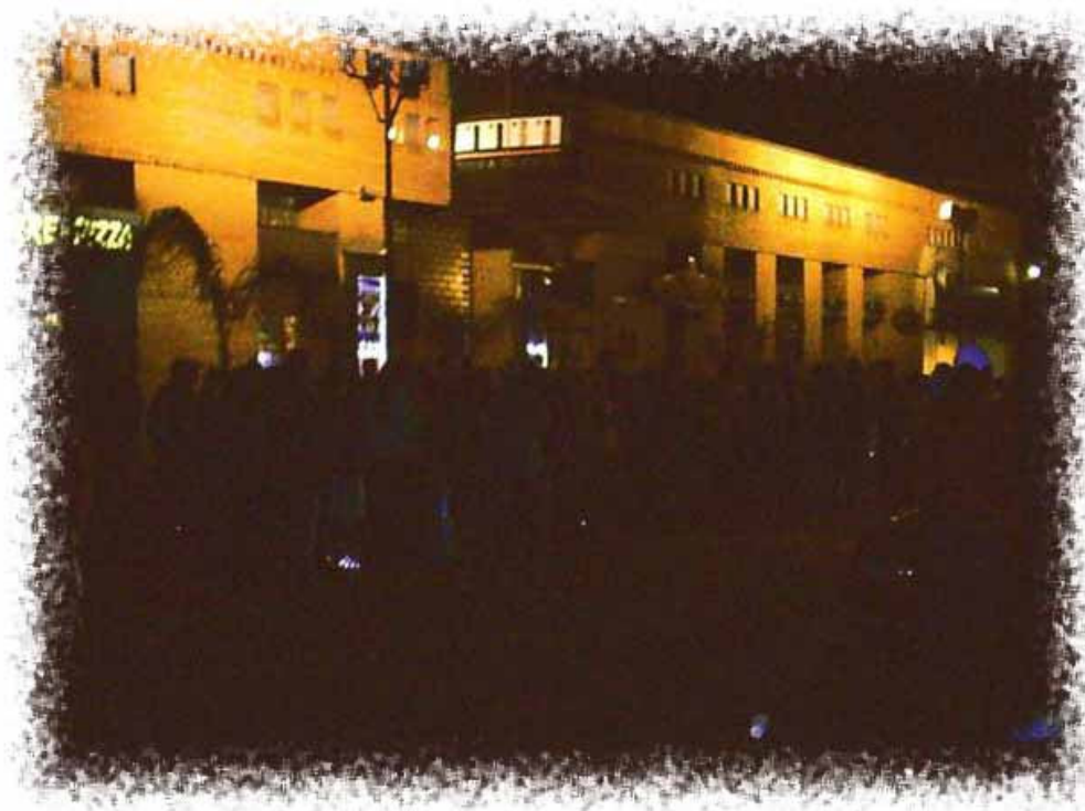
Figura 2: Shopping Nova Olaria, domingo, final de tarde de inverno, 2007.

Apresento esta fotografia, produzida num domingo do inverno de 2007, que mostra a fachada do referido Shopping , por volta das seis e meia da tarde: centenas de jovens ‘ocupam’ o lugar, chegando ‘aos bandos’, tomando conta não somente da calçada, mas invadindo a rua, encostando-se aos carros, às paredes das casas, sentando no chão e circulando incessantemente pelo meio da rua. Transitam com garrafas plásticas, contendo vinho, garrafa esta que passa de mão em mão, em meio a risadas sonoras, cumprimentos efusivos e muitos beijos na boca. Trago tal fotografia como contraponto à figura apresentada anteriormente, para salientar a ‘diferença’ da paisagem urbana, para mostrar a ‘lugarização’.