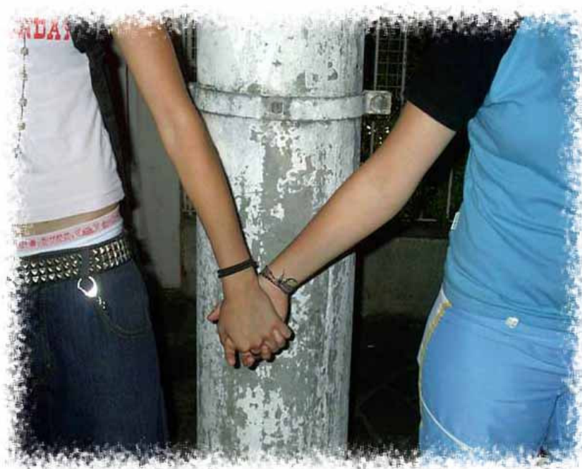
Figura 6: O poste e os resíduos.

Nem todos estão em movimento por preferirem isto a ficar parados ou porque querem ir aonde vão. Muitos talvez preferissem ir a outros lugares, ou mesmo não se movimentarem, se pudessem escolher; mas não lhes deram opção: estão se movendo porque foram empurrados. Nas palavras de Bauman (1999, p.105), tanto o turista (aquele que se move por opção) como o vagabundo (o que só tem como opção o movimento) foram transformados em consumidores, mas o vagabundo é um consumidor frustrado, seu potencial de consumo é tão limitado quanto seus recursos. Essa falha torna precária a sua posição social. Os vagabundos quebram a norma e solapam a ordem. “São uns estraga-prazeres meramente por estarem por perto, pois não lubrificam as engrenagens da sociedade de consumo, não acrescentam nada à prosperidade da economia transformada em indústria de turismo. São inúteis, no único sentido de utilidade em que se pode pensar numa sociedade de consumo ou de turistas . E por serem inúteis são também indesejáveis e, como indesejáveis, são naturalmente estigmatizados, viram bodes expiatórios. Mas seu crime é apenas desejar ser como os turistas sem ter os meios de realizar os seus desejos como os turistas ”.