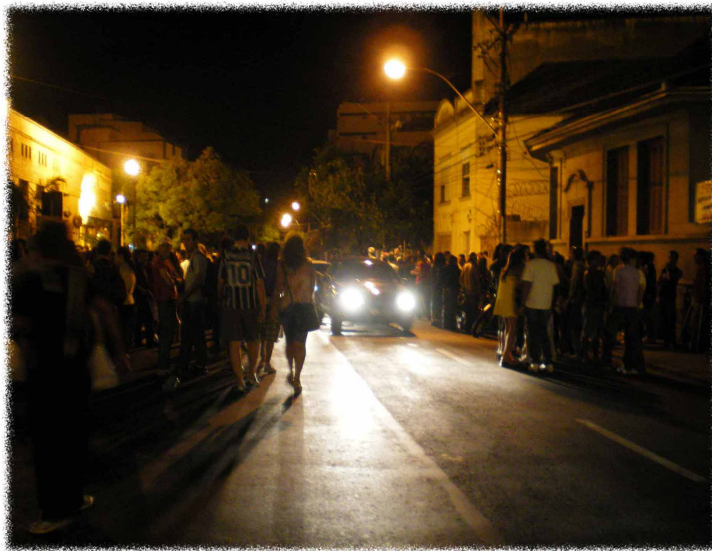
Figura 12: A rua trans-viada em vitrine.

Trago esta imagem para poder pensar a rua como ‘palco’ dessa juventude que não pode ser reduzida a uma rígida classificação etária ou sociológica baseada em idade, mas como uma fração do universo jovem, produzida, a partir das práticas lugarizantes que lhe promove visibilidade; juventude que vê e é vista. A rua, então, torna-se vitrine, numa comunicação entre os que olham e os que são olhados, e, nesse sentido, Canevacci (2005, p. 7) sublinha que as culturas juvenis escapam das lógicas tradicionais, desenhando “constelações móveis” desordenadas, de faces múltiplas, que passam pela metrópole. Velocidade, imagem, sensação, sociabilidade, experiência, espaço, performance. Juventude afetiva, quebradiça, imprevisível, provocativa.