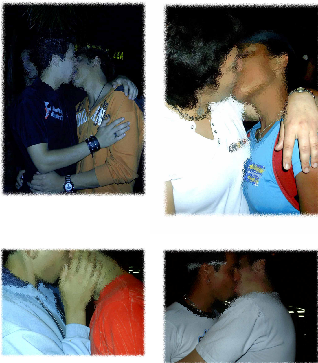
Figura 13: Aqui a gente olha...e fica!

Carões, montações, beijos demorados, ficadas, grudações, bem como os cumprimentos, os modos de se movimentar, de 'desfilar', a maneira de olhar, de encarar e de conversar, podem ser vistas, nesse grupo, como experiências pautadas pela instantaneidade, regidas por uma lógica de 'ver e ser visto'. Tais práticas também sugerem que distintas dinâmicas de afeto, amizade e sociabilidade parecem