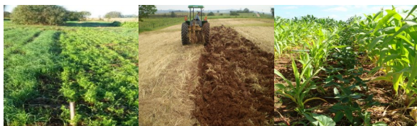
Figura 1. Vista do experimento de manejo do solo, conduzido há 30 anos (a); Sistemas de preparo do solo (b); Sistemas de culturas (c).