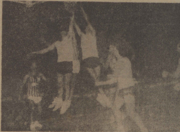
No basquete quem venceu foi o público santa-mariense, que assistiu a partidas de excelente índice técnico