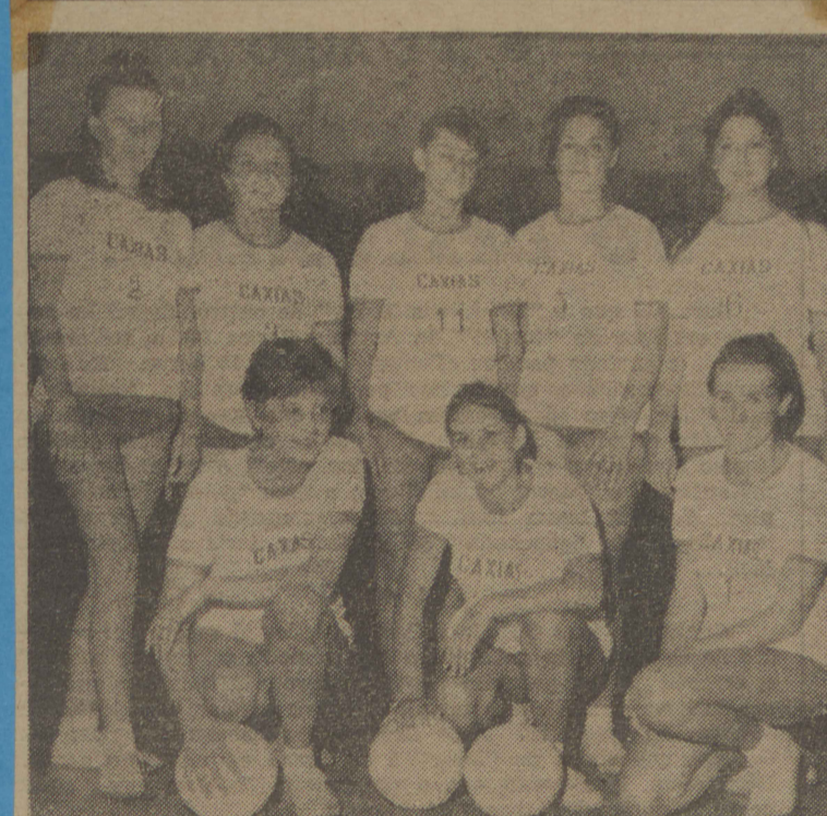
ATLETAS CAXIENSES EM SANTA MARIA

As bonitas atletas caxienses estiveram em Santa Maria, por ocasião dos II Jogos Intermunicipais do Rio Grande do Sul, defendendo o vôlei feminino. Suas impressões quanto à realização dos Jogos de Santa Maria, foram das melhores e são fartos os elogios quanto à organização dos mesmos