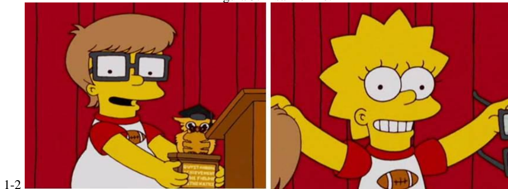
Figura 5: Lisa menino.