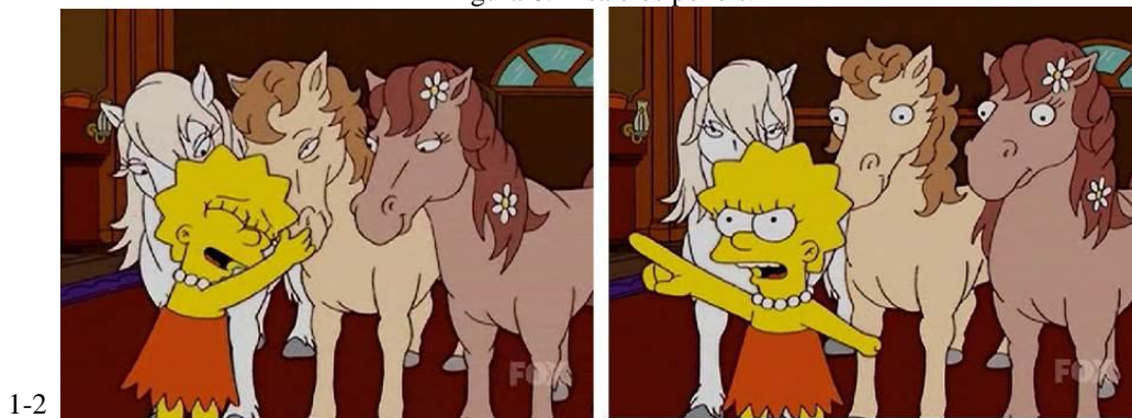
Figura 6: Lisa e os pôneis.