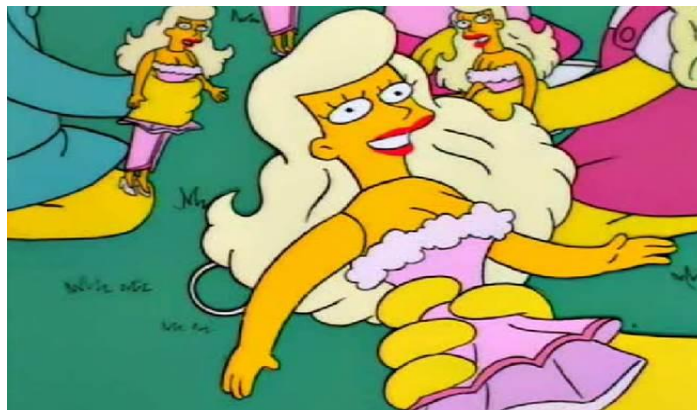
Figura 1: a boneca Malibu Stacy.