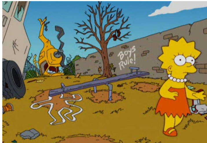
Figura 4: Lisa no lado dos meninos.