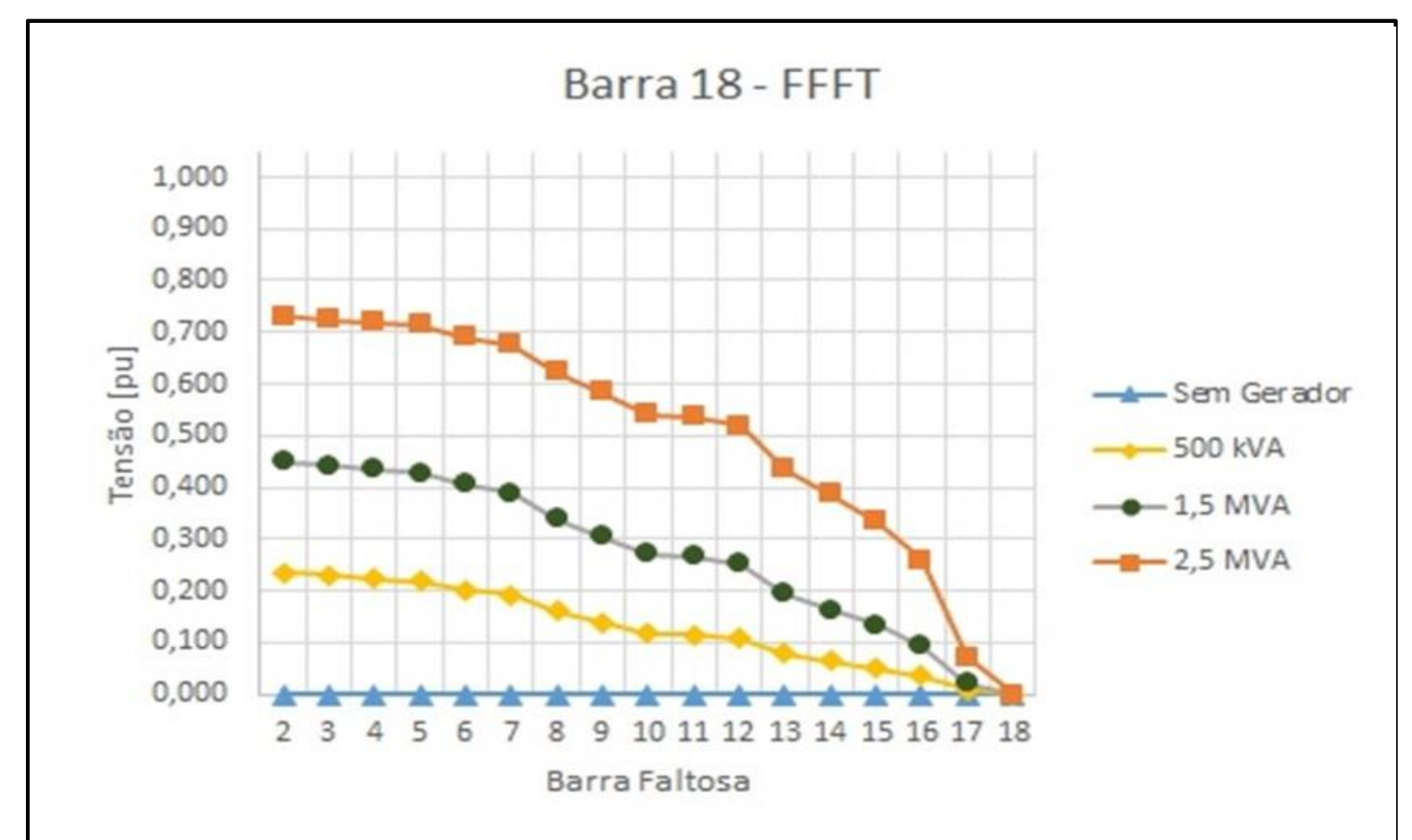
Figura 3 - Falta FFFT nos nós 2 a 18.

A aplicação de uma falta trifásica à terra produz os afundamentos de tensão mais severos. A inserção do gerador não apresenta melhora significativa quando a falta acontece muito próxima ao nó onde ele foi adicionado, como apresenta a Figura 3. Quando a falta é aplicada no ponto mais distante, no nó 2 distante 14 km do nó 18, a melhora nos níveis de tensão com a inserção da minigeração é mais expressiva. A melhora é maior de acordo com a potência do gerador adicionado, porém a elevação da tensão observada não elimina os afundamentos de tensão decorrente de faltas entre a subestação e a barra do gerador.