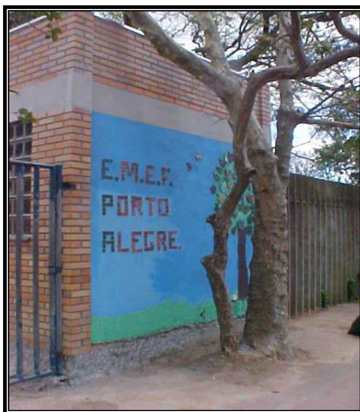
Figura 2: Fachada da Escola

O histórico da escola aqui apresentado é resultado da pré-pesquisa, realizada durante o período de trabalho de campo, em 2008, constituído a partir de visitas, entrevistas e pesquisa documental.