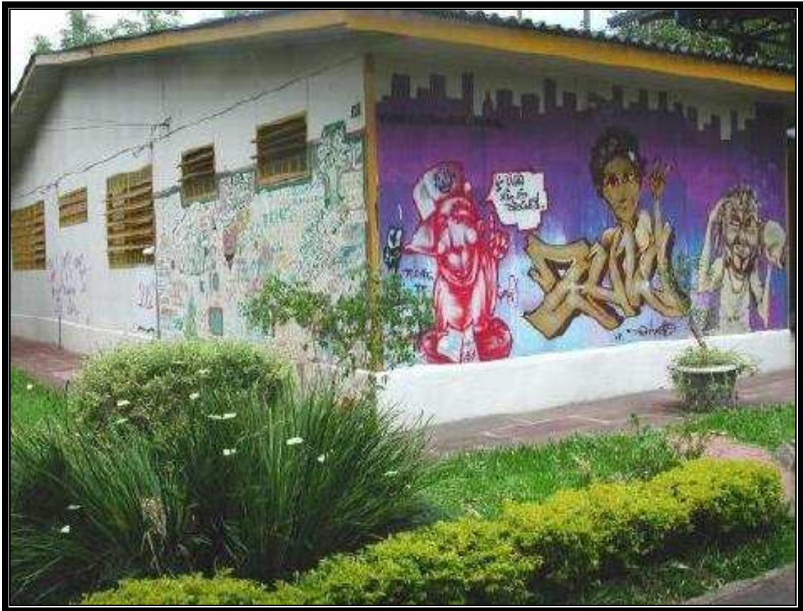
Figura 3: Jardim e Prédio Principal da Escola

físico e repensou sua metodologia de trabalho constantemente, em consonância ao vivido por seu público atendido.