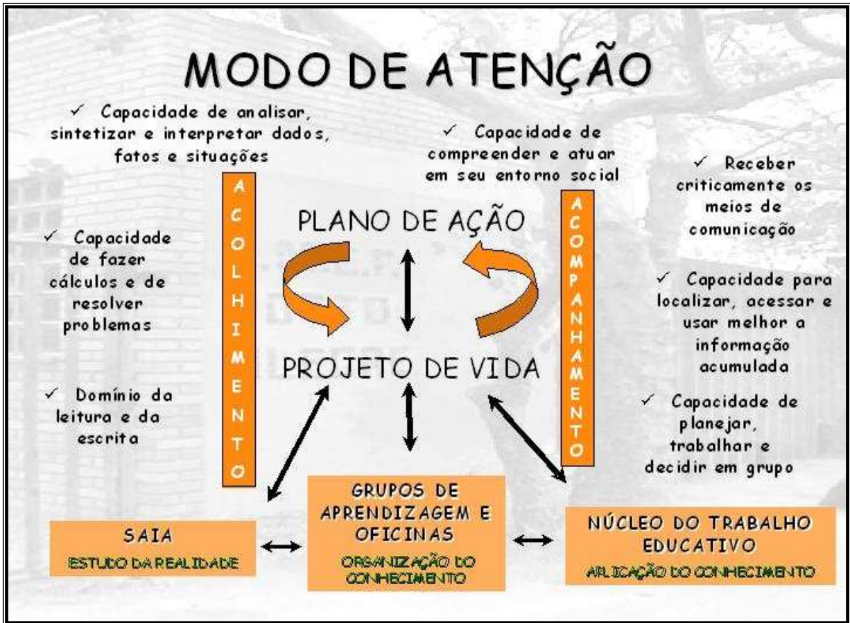
Figura 5: Modo de Atenção proposto pela escola