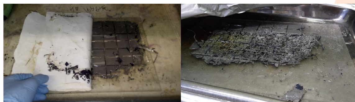
Resultado da separação após experimento de 8 dias de imersão