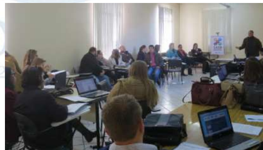
Fotografia 1. Oficina Regional de Capacitação dos servidores municipais

Nas capacitações dos servidores municipais, a exemplo da Fotografia 1, a equipe do SASB apresentou os manuais relativos aos produtos que seriam elaborados pelos servidores.