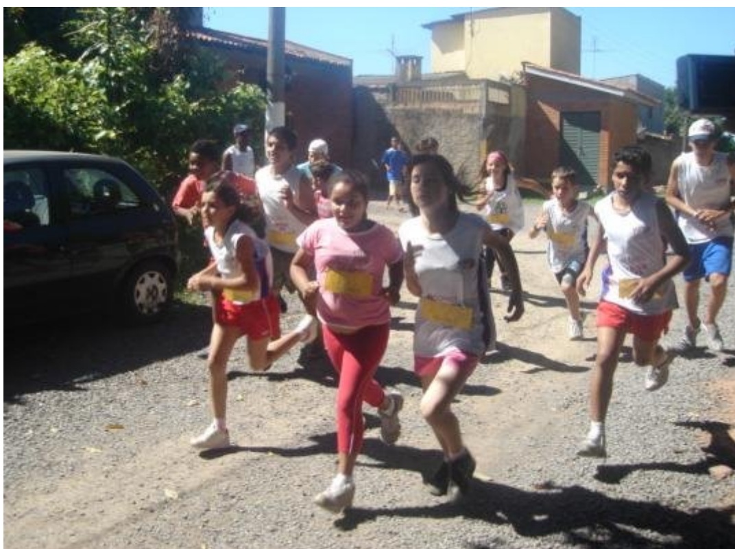
Figura 12 - Disputa interna de cross-country infantil no Parque Galvany Guedes. Ano 2008.

Além dos treinamentos, são organizadas – geralmente, em algum sábado, domingo ou feriado do mês, competições, dentro do próprio local de treinamento (o Parque Galvany Guedes), nos arredores, ou no centro de Esteio, que tem o objetivo de integrar todos os participantes e premiá-los com troféus e medalhas de acordo com seus desempenhos. É um grande estímulo, sem dúvida nenhuma, para que as crianças e adolescentes sigam fiéis aos treinamentos em busca de melhores resultados.