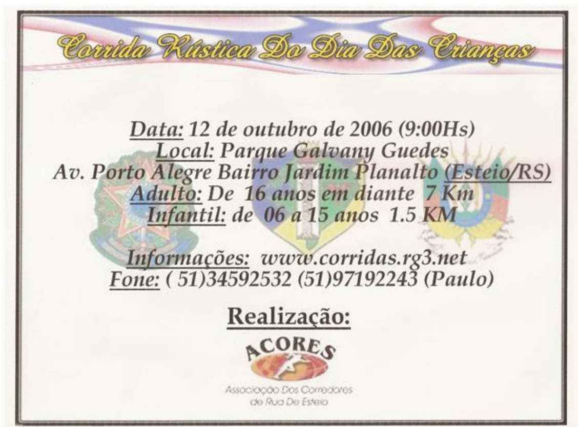
Figura 8 - Folder organizado pela ACORES para divulgação de corrida. Ano 2006.

Além das provas para adultos, as diretorias da ACORES sempre se preocuparam com a organização de provas infantis, com quilometragens reduzidas, e com nenhum custo de inscrição para os participantes.