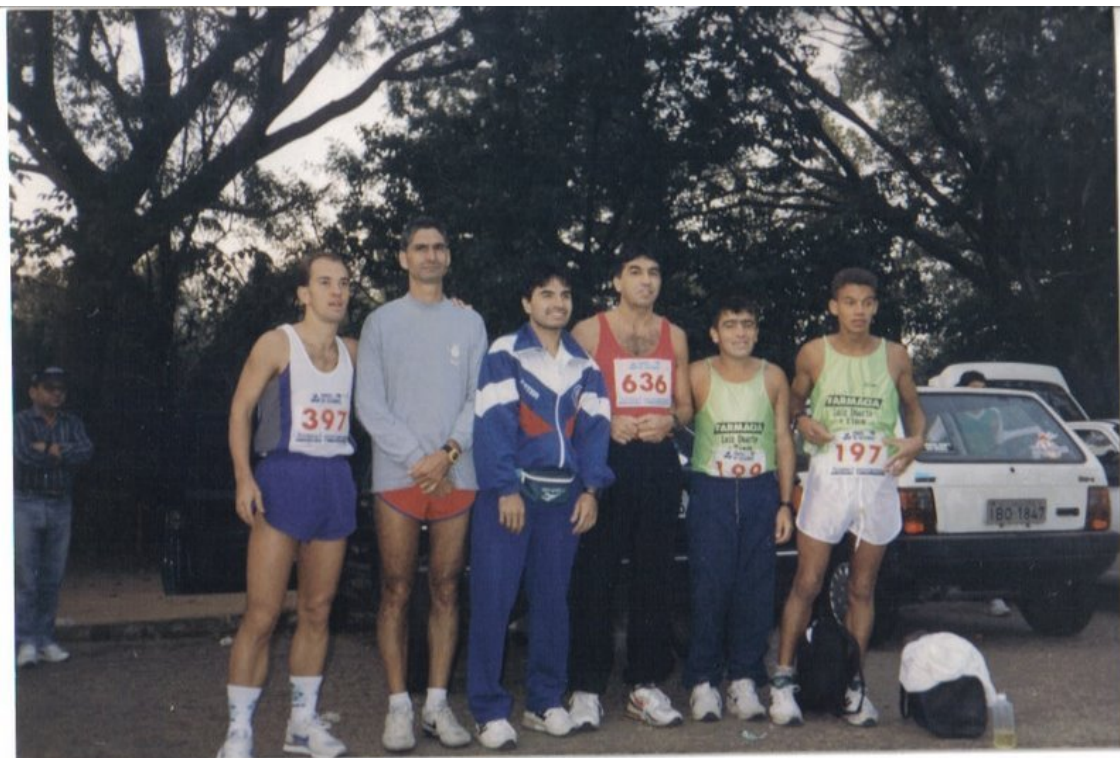
Figura 3 - Participação dos atletas da ACORES na Rústica de Gravataí/RS. Ano 1998.

Farroupilha, Gravataí, Novo Hamburgo, Portão, Porto Alegre, Rio Grande, São Leopoldo; São Sebastião do Caí; Sapucaia do Sul, Tramandaí, Lajeado; Arambaré; Nova Prata; Encantado. Em algumas corridas, a associação bancava as despesas com transporte e alimentação dos atletas associados. Em outras, as despesas eram pagas pelo Conselho Municipal de Desportos, e em algumas corridas, a ACORES pagava as inscrições dos atletas associados.