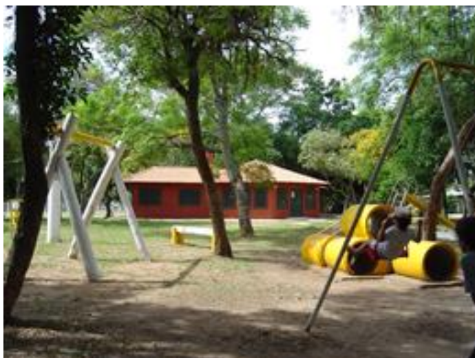
Figura 13 - Parque Municipal Galvany Guedes, onde parte dos atletas da ACORES costuma treinar. Fonte: www.esteio.rs.gov.br/ . Ano 2009.

Assim, o Parque Galvany Guedes, situado na Av. Porto Alegre, 505, passou a ser referência como sede da ACORES.