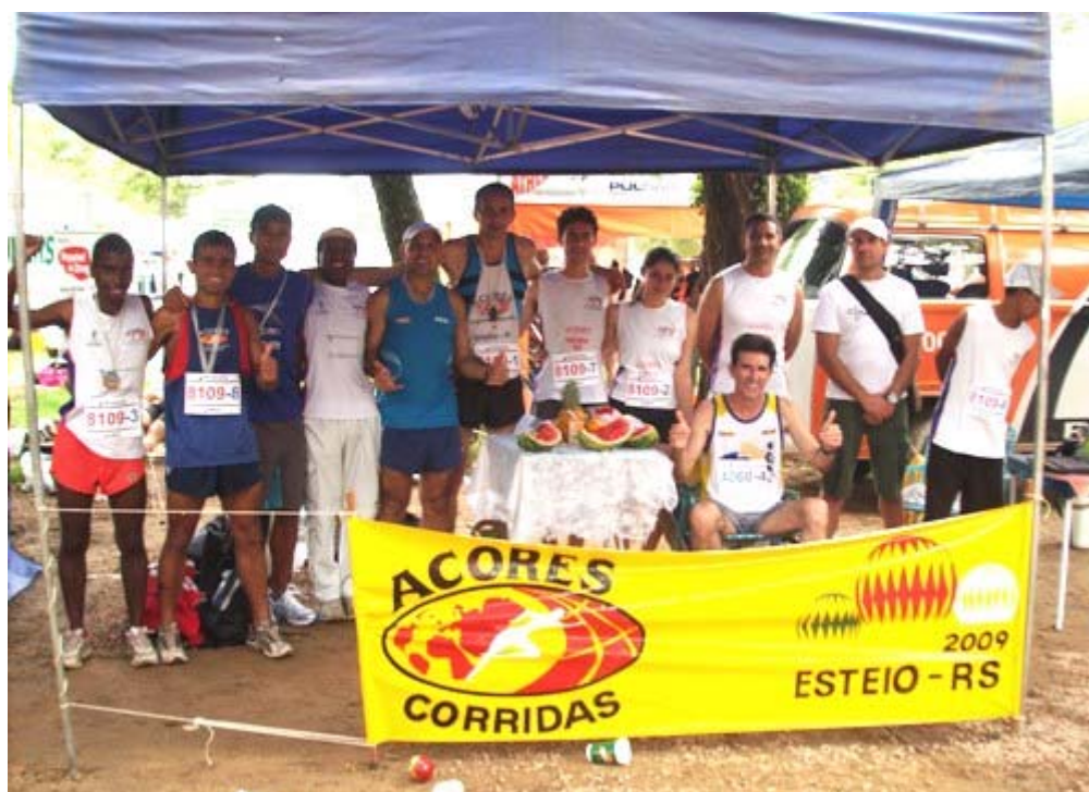
Figura 5 - Participação da ACORES na V Maratona de Revezamento da Paquetá. Ano 2009.