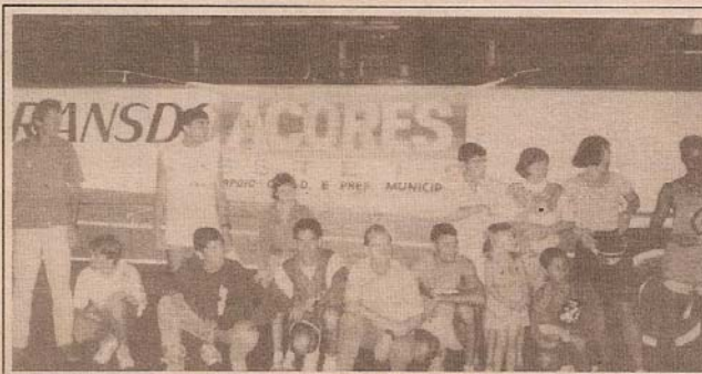
Atletas da Acores posam junto ao ônibus cedido pela Prefeitura Municipal, numa das participações fora do município

Eventos: além dos programados para se realizarem em Esteio, como as rústicas de 23 de abril, 15 de outubro, 30 de dezembro e a