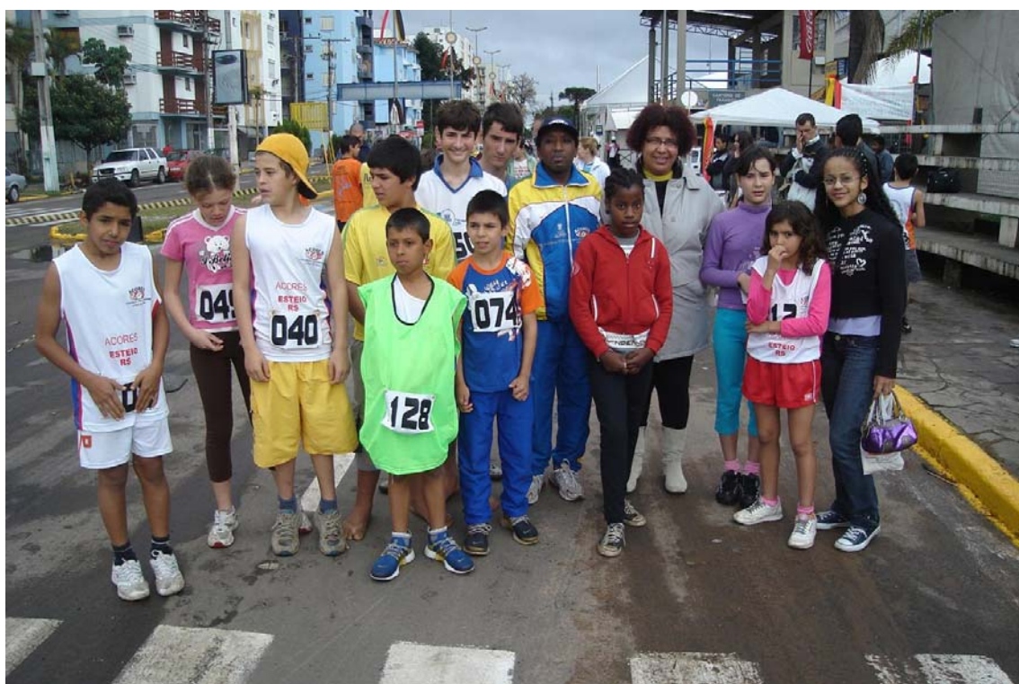
Figura 11 - Equipe infantil do projeto participando da Mini-rústica de São Leopoldo. Ano 2008.