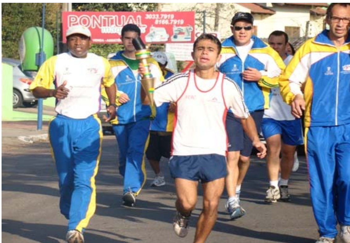
Figura 6 - Corrida do Fogo Simbólico da Chama da Pátria. Ano 2009.

Anualmente, os corredores da ACORES, desde a sua fundação, são convidados pelas autoridades a participarem de um valioso ato cívico, a Condução da Chama, na Corrida do Fogo Simbólico da Pátria. Neste evento, os atletas recebem o Fogo Simbólico, normalmente na divisa com o município de Canoas, e percorrem as principais ruas da cidade de Esteio, até chegarem a Prefeitura Municipal para acenderem a Pira.