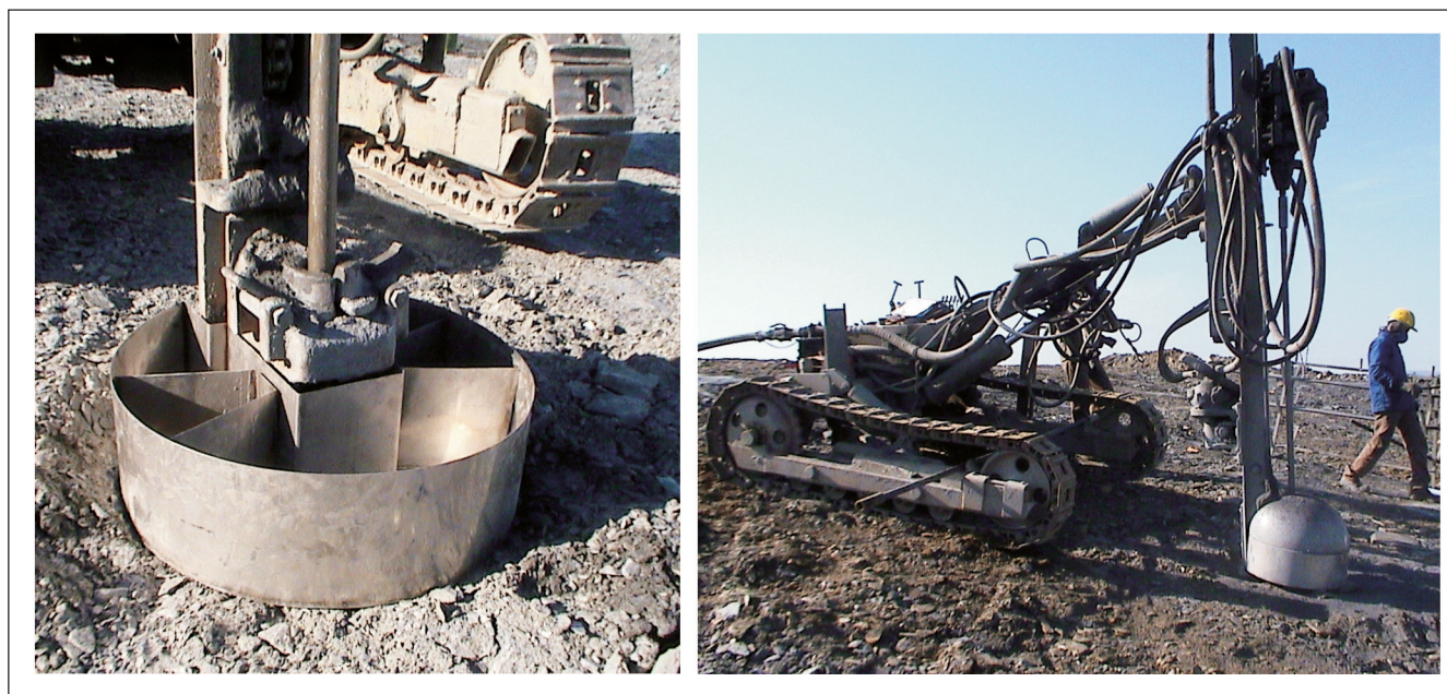
Figura 2 - Amostrador setorial acoplado à lança da perfuratriz.