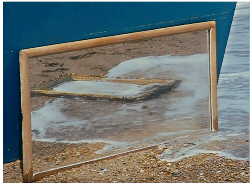
Fotograma de As Praias de Agnès (2008), de Agnès Varda.