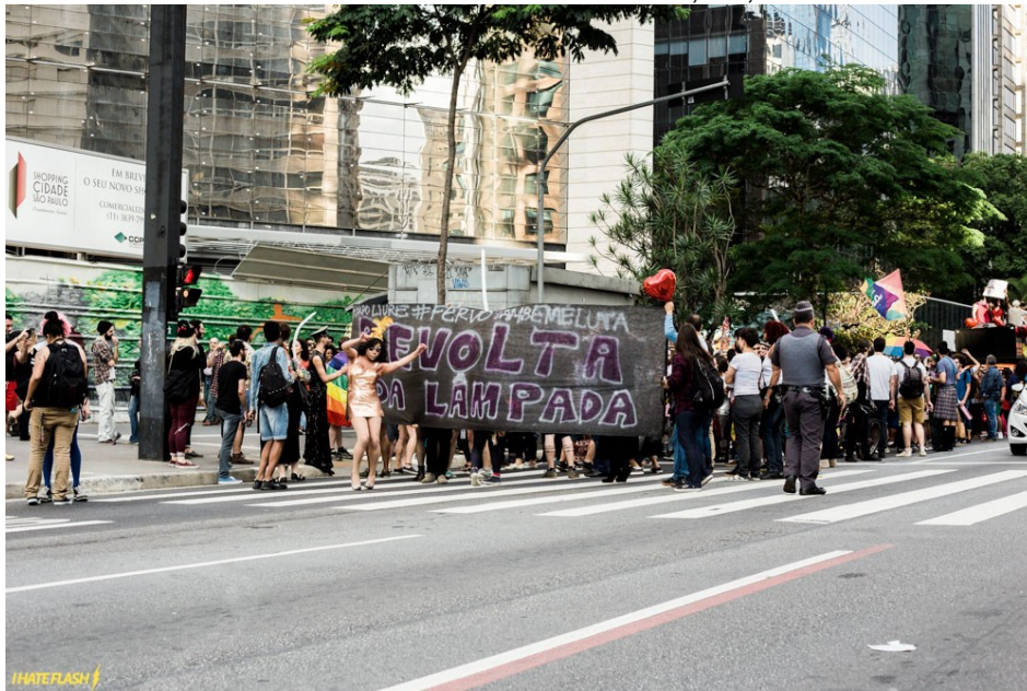
São Paulo, 2014