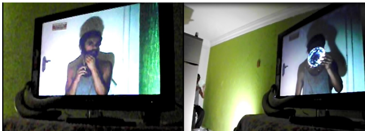
Autor desconhecido, 2014

Concluir o ensino superior na universidade pública na área das artes me proporcionou uma vivência mais direta com as manifestações concretas dessa força sócio-política tão presente quanto a gravidade. Ainda que amparado por diversos privilégios de classe e raça - pessoa branca de classe média -, sou atravessado pelos vetores da precariedade à medida que me especializo em viver com honestidade e lealdade aos meus desejos e ética de afirmação de vida.