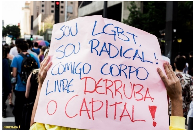
São Paulo, 2014.