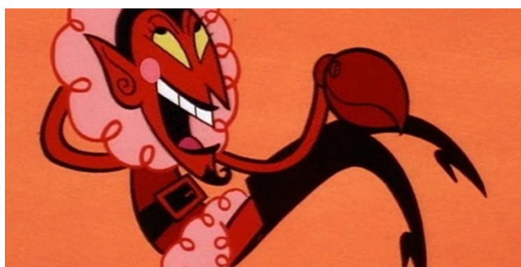
FIGURA 4- ELE

Disponível em https://www.cbr.com/powerpuff-girls-him-beatles-cartoon-yellow-submarine-subversive-villain/