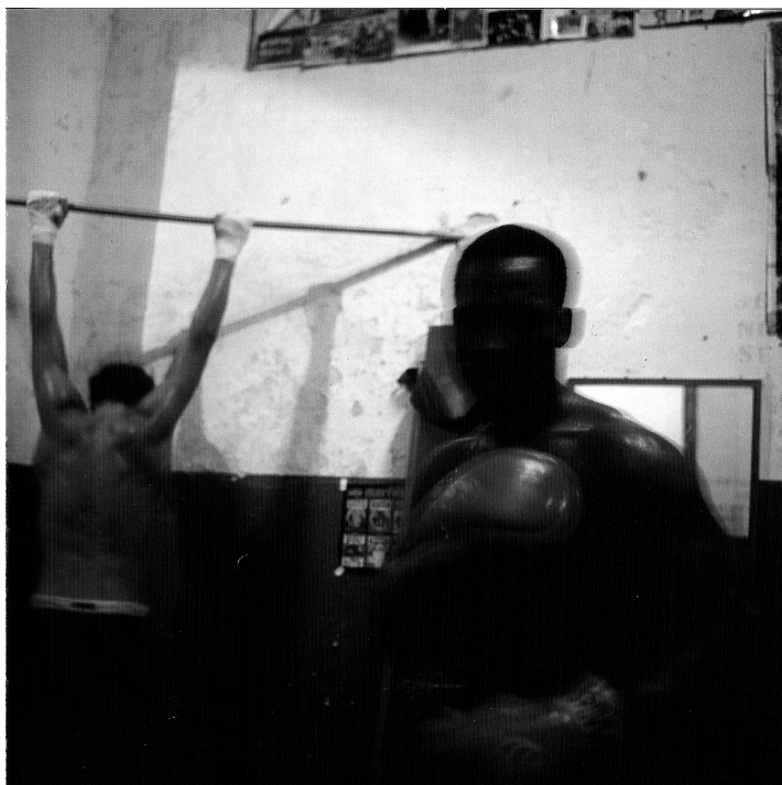
Figura 4 – Fotografia de Miguel Rio Branco, Silent Book , 1997.

autônomas, abstraídas do vínculo remissivo de origem, essas imagens situam-se num presente sempre renovado que desperta um passado e prenuncia um futuro igualmente abertos (Fatorelli, 2003: 33).