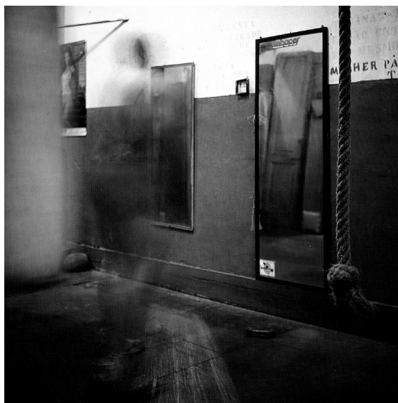
Figura 2 – Fotografia de Miguel Rio Branco, Silent Book , 1997.