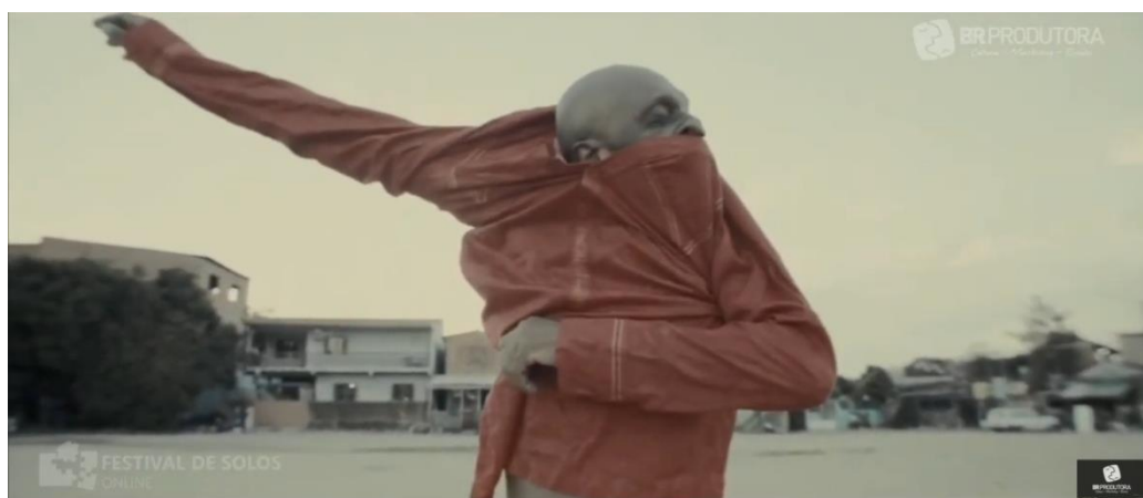
Figura 13 – Imagens da cena seis do espetáculo “Co Ês”