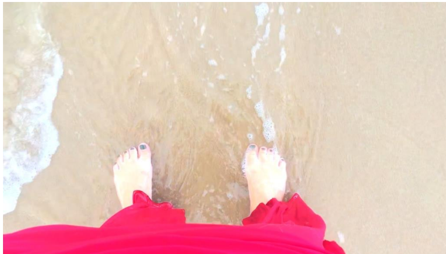
Figura 2 – Imagens do processo “Cura em Espiral Violeta”