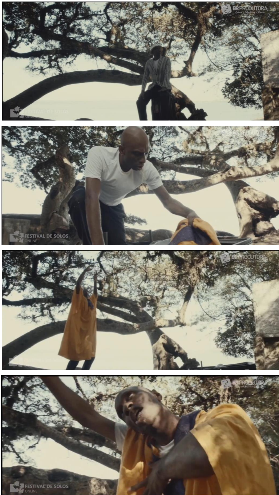
Figura 5 – Imagens da cena dois do espetáculo “Co Ês”