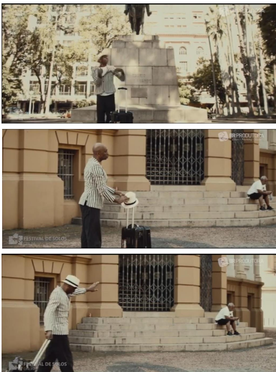
Figura 3 – Imagens da cena um do espetáculo “Co Ês”