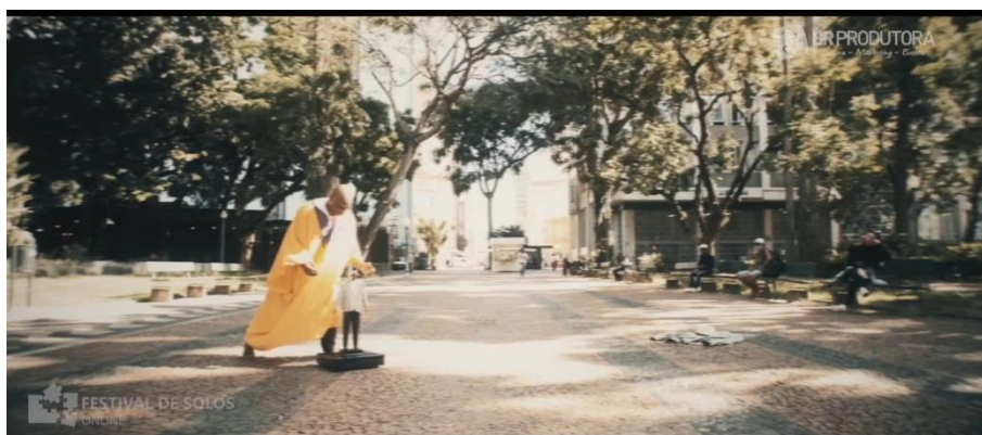
Figura 7 – Imagens da cena três do espetáculo “Co Ês”