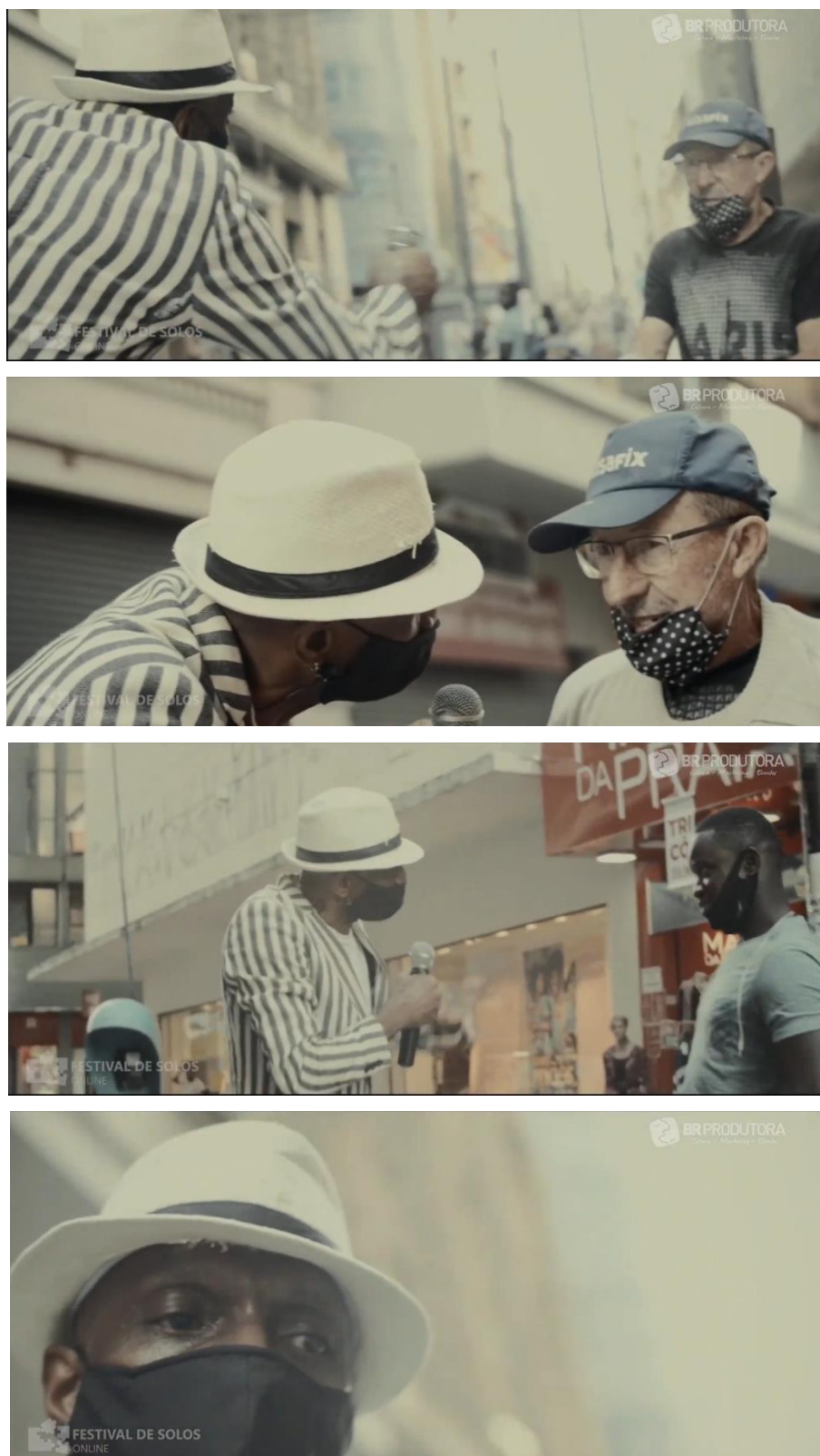
Figura 9 – Imagens da cena quatro do espetáculo “Co Ês”