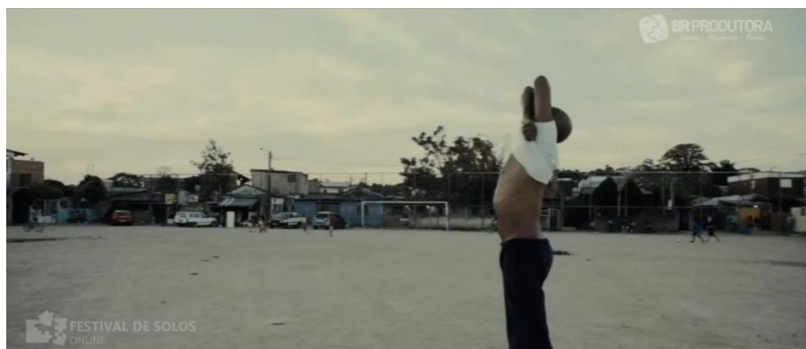
Figura 11 – Imagens da cena cinco do espetáculo “Co És”