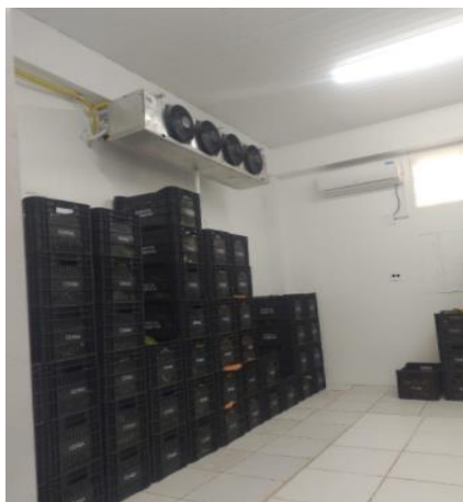
Figura 22: Câmara fria que foi doada ao banco de alimentos da Ceasa/RS.