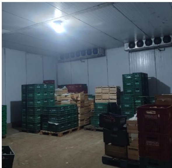
Figura 11: Imagem interna da unidade de armazenagem do maior atacadista de tomate da Ceasa/RS.

Em relação às câmaras frias, todos os atacadistas indicaram que são essenciais para segurar o amadurecimento do fruto. Não são todos os comerciantes de tomate que possuem unidades de armazenagem, mas os maiores e em sua maioria possuem câmara fria (Figura 11) ou espaços em que há um controle da temperatura para manter os tomates já embalados para venda futura. O manejo da temperatura (controle) e da umidade faz com que os tomates recebidos ainda verdes de outros estados tenham uma vida de prateleira prolongada até duas semanas. Este procedimento é uma recomendação técnica de vários autores, entre os quais, Chitarra e Chitarra (1990).