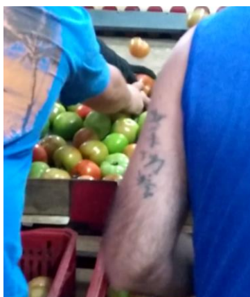
Figura 7: Máquina classificadora de tomates de atacadistas menores instalados na Ceasa Porto Alegre.

A observação apresentada pelos atacadistas especializados no comércio de tomates, é que as dimensões das classificadoras que afetam em percentuais de perdas são inusitadas. São observações que relacionam um efeito, mas cuja causa apontada não