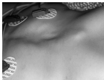
Figura 2. pectus escavatum.