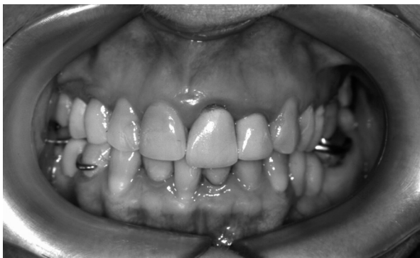
Figura 5. Aspecto da má oclusão, com tendência para estreitamento dos arcos dentários e excesso vertical maxilar.