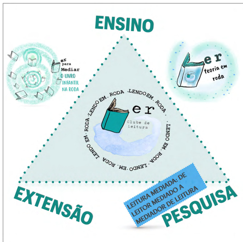
Figura 1 - Tripé pesquisa-extensão-ensino