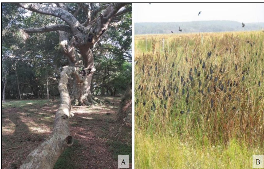
Figura 4 – Imagem da mata nativa (A); Imagem da observação de aves (B).