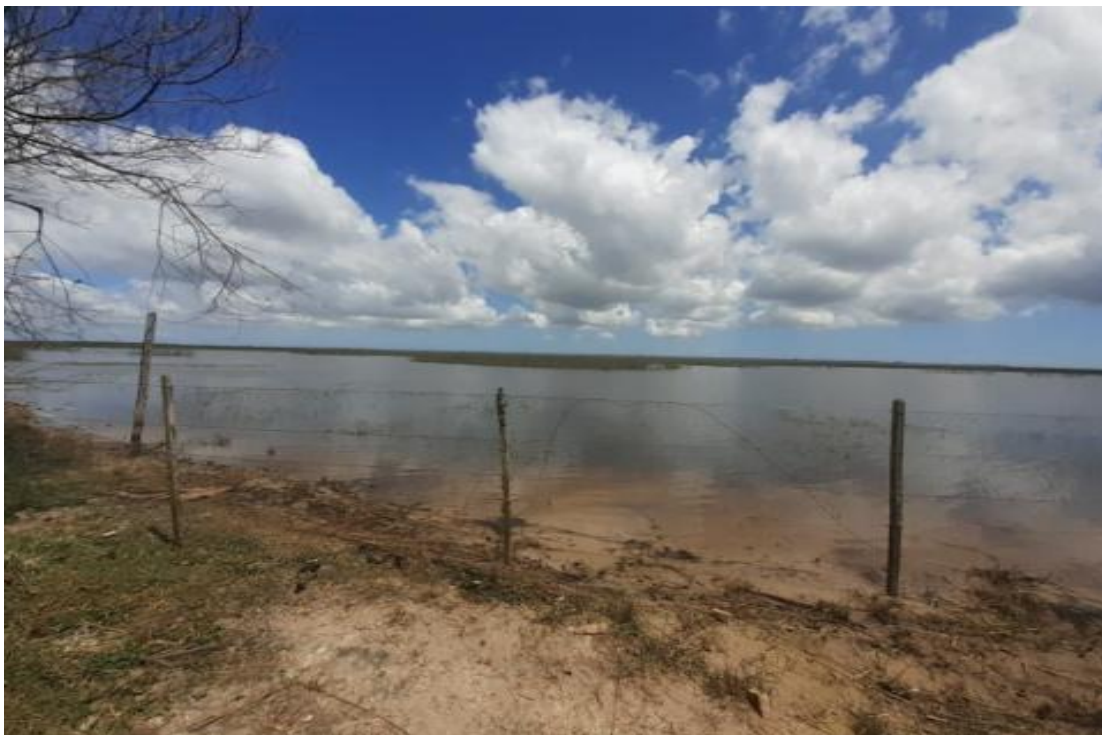
Figura 3 – Imagem da Lagoa do Rincão.