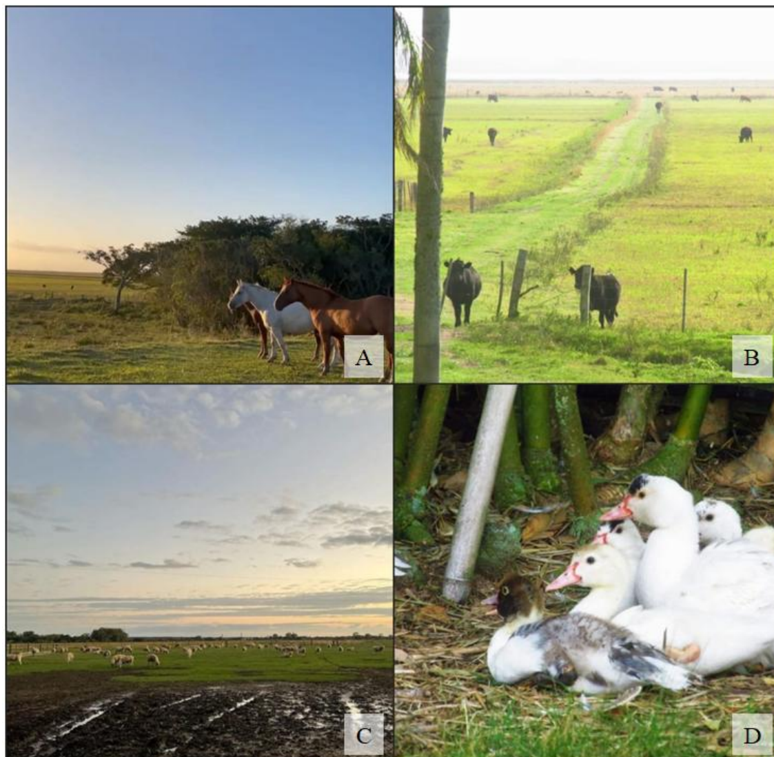
Figura 5 – Imagens de: cavalos para passeios (A); Criações de bovinos (B); Rebanho de ovinos (C); Criações de aves (D).