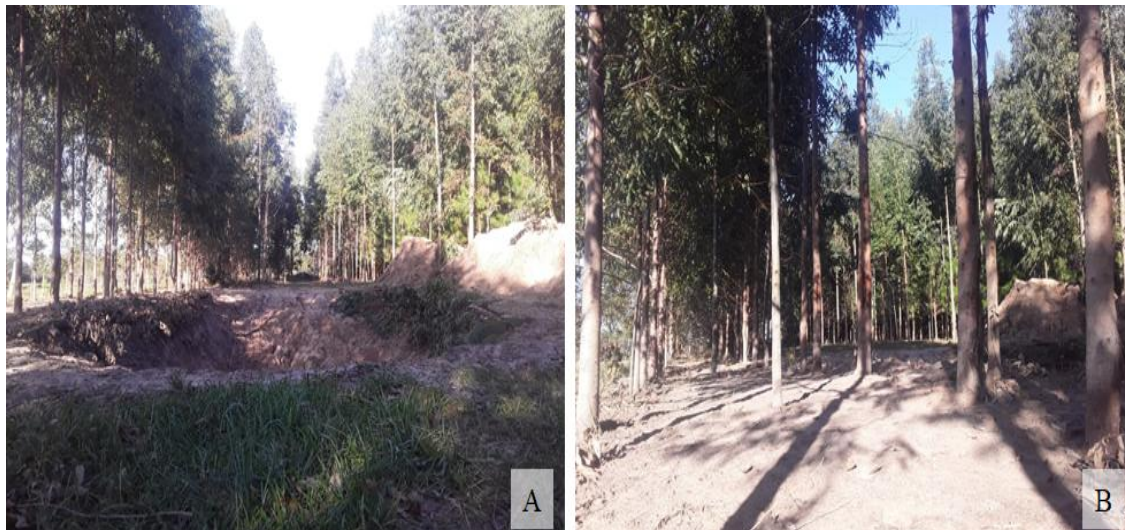
Figura 7 – Imagens do local da escavação do tanque (A) e do local onde será construído o quiosque (B).