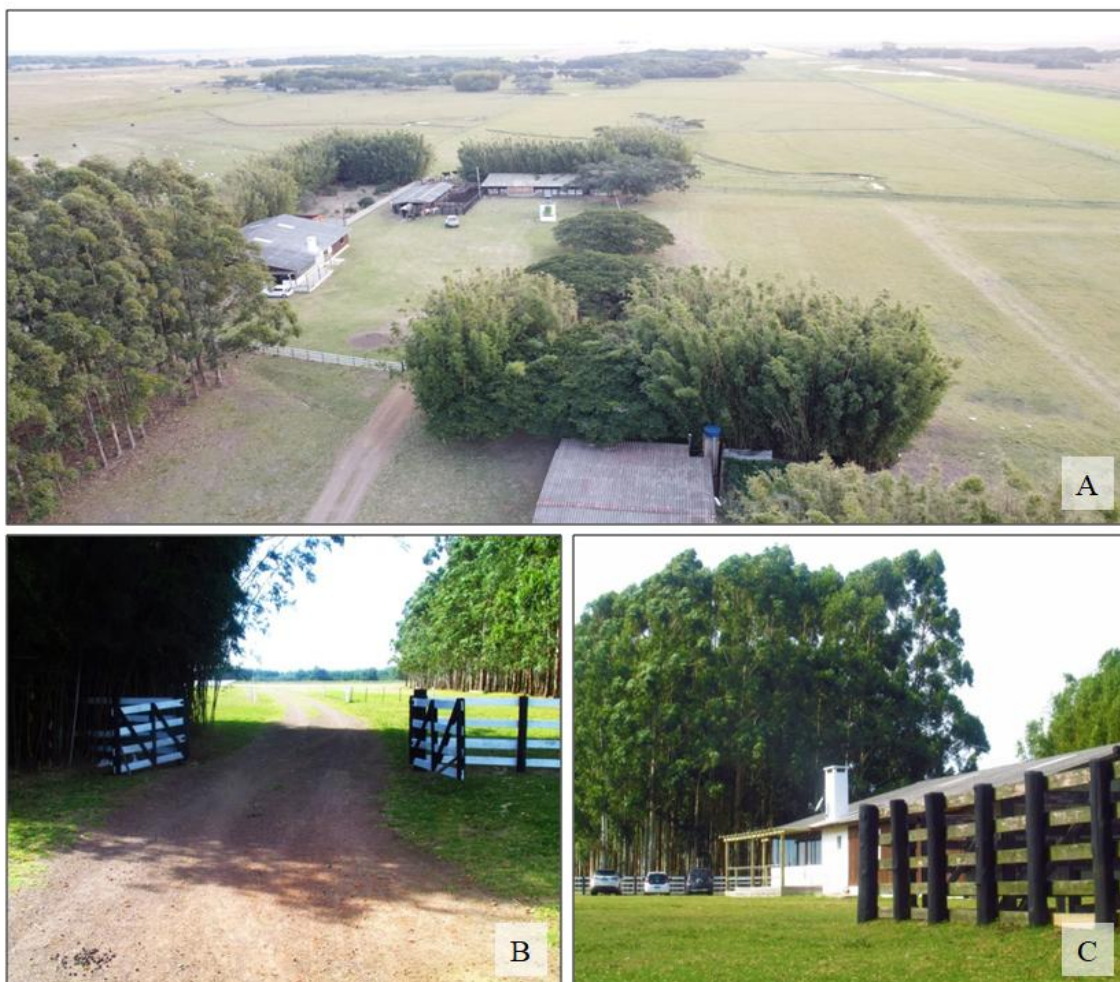
Figura 2 – Ilustrações da Propriedade Chácara Litoral (A); Acesso a propriedade (B); Local de eventos (C).