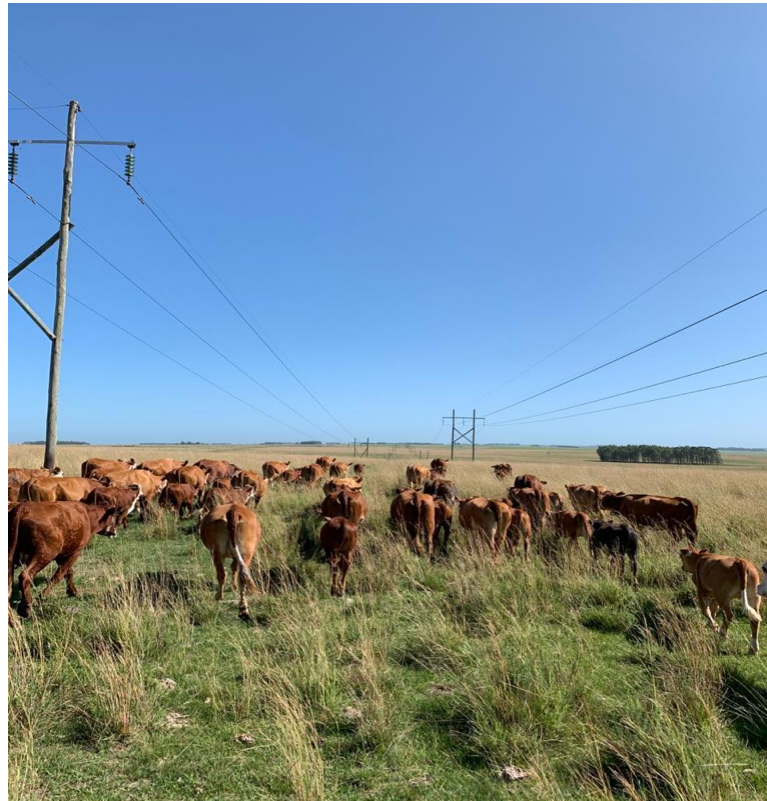
Figura 1:Rebanho de cria Braford em rotação de piquete de campo nativo.

( Adesmia sp.); Flechilha ( Stipa sp.); Caraguatá ( Eryngium sp.); Capim-Melador ( Paspalum dilatatum Poir); Capim-touceirinha ( Sporobolus indicus ), além de espécies invasoras como Annoni ( Eragrostis plana ). Além da diversidade florística regional, a fauna nativa também é representada por uma grande variedade de espécies, tanto mamíferos, aves, répteis e insetos.