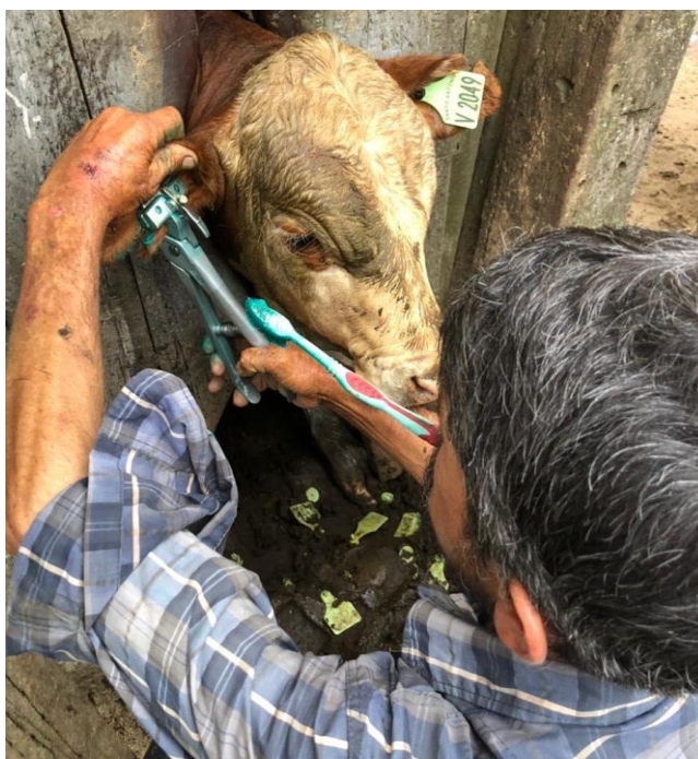
Figura 6: Tatuagem em terneiro Braford.