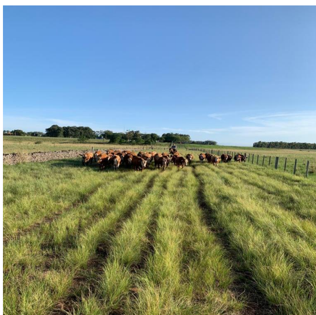
Figura 3: Rebanho de novilhos em transição de campos, transitando em corredor estruturado, facilitando o manejo.

Conforme chegam mais próximo do objetivo de peso e acabamento, o gado para terminação é alocado nas pastagens cultivadas de modo a otimizar o período de terminação dos animais. O gado de cria durante a gestação e lactação, fica alocado em campos nativos de boa qualidade. O rebanho de vacas falhadas, como não atingiram seu objetivo, são alocadas nos piores campos. As áreas com maior abundância de pastagem de boa qualidade, são alocadas também o lote de primíparas, visando a manutenção, crescimento e lactação destas, favorecendo o desenvolvimento e a repetição de cria no próximo ciclo. Touros de ano e sobreano, também são alocados em campos com boa qualidade forrageira, pois necessitam de um bom aporte nutricional para otimizar seus resultados.