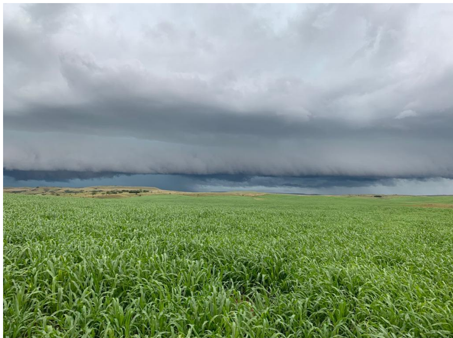
Figura 2: Capim-Sudão implantado em área anteriormente de campo nativo.

Semanalmente foram realizadas visitas às áreas de pastagens cultivadas com acompanhamento do engenheiro agrônomo, onde era verificado o estado da pastagem e a necessidade de adequar a carga animal e estabelecer o período de entrada e saída do rebanho. No dia a dia das estâncias, quando na recorrida diária ou na realização de qualquer outra atividade, os capatazes observavam as pastagens e informam a necessidade ou não da realização de manejos na área. A verificação das condições das pastagens é realizada através da avaliação visual, tanto pelo agrônomo quanto pelos demais funcionários, estes, realizam a verificação da altura das plantas baseadas na altura de suas botas. A verificação da do resíduo da pastagem após o pastejo é realizada pela altura do resíduo das pastagens, buscando manter área foliar que possibilite a planta interceptar radiação, favorecendo sua renovação e crescimento.