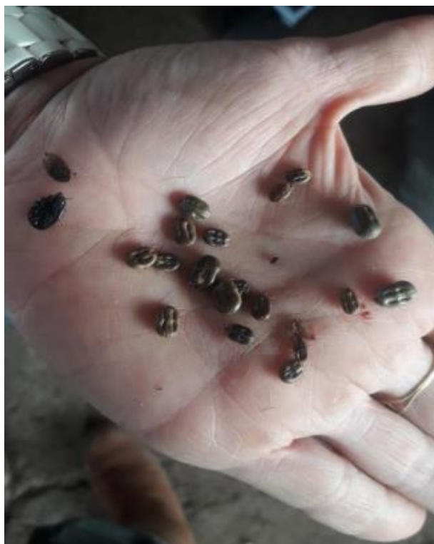
Figura 5: Avaliação do grau de infestação e estágio de desenvolvimento de carrapato.