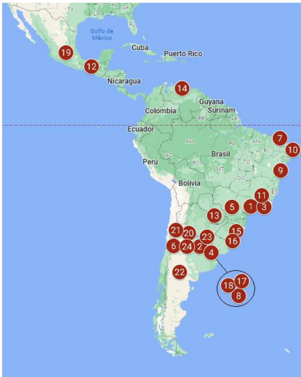
Figura 4 - Ubicación geográfica de las formaciones en música popular en universidades públicas de América Latina

A continuación, se incluye un breve recorrido histórico de las formaciones y sus respectivas universidades. Las informaciones fueron extraídas tanto de la web como de los documentos curriculares recolectados.