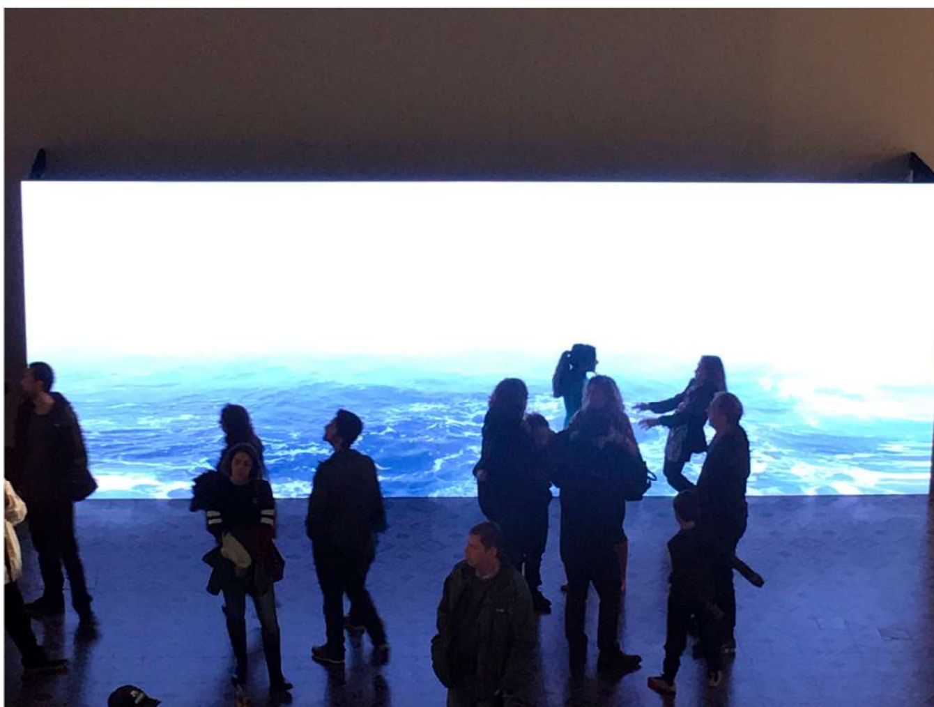
Figura 1 – MARGS-Noite dos Museus 2018.