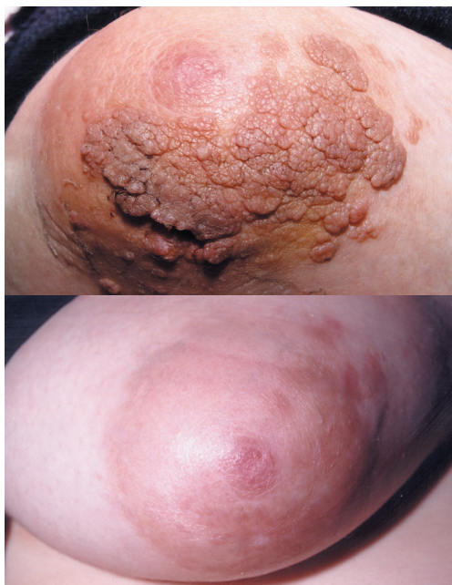
FIGURA 1: A - Nevo epidérmico sobre região da aréola e pele adjacente. B - Aspecto clínico 90 dias após realização de shaving e eletrocauterização