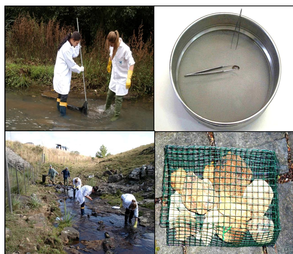
Figura 2: Métodos de coleta: A) Kick sampling ; B) Coleta manual C) Peneira e D) Basket sampler

O Índice Biológico de Integridade Ambiental (IBIA) foi feito a partir da adaptação dos índices BMWP (Newman, 1988) e ASPT (Armitage et al , 1983) por substituição de grupos que não ocorrem ou tem baixa representatividade na região; modificação dos scores de táxons presentes nos índices originais e inclusão de táxons existentes na região. As metodologias estatísticas aplicadas foram: análise de amplitude do hábitat segundo o IQ (mediana e percentis de 25% e 75%), análise de frequência da ocorrência dos táxons nas classes do IQ, análise de cluster (Distância Euclidiana), análise de correlação de Spearman ( \alpha = 0,05 ). Após, foram atribuídos valores de 2 a 10 aos táxons, de acordo com seu grau de tolerância (Tabela 1), e aplicou-se o índice na área de estudo.