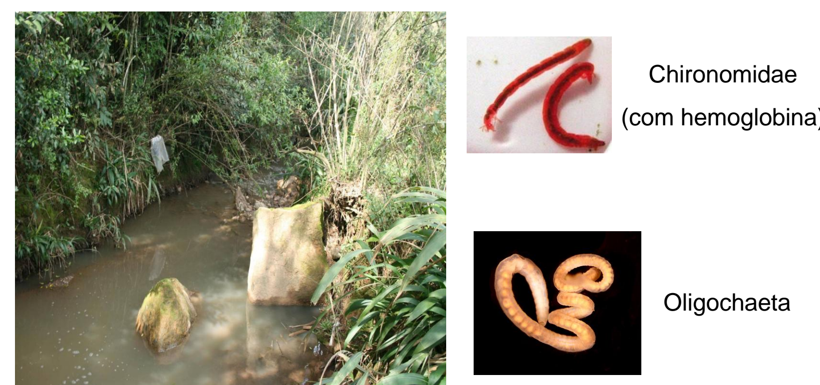
Figura 5: Arroio de nome desconhecido em São Marcos – Muito pouca integridade