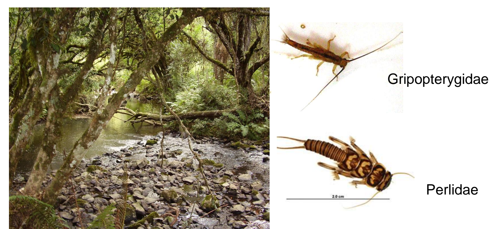
Figura 3: Arroio Restinga Feia (Cambará do Sul) – Ambiente íntegro: