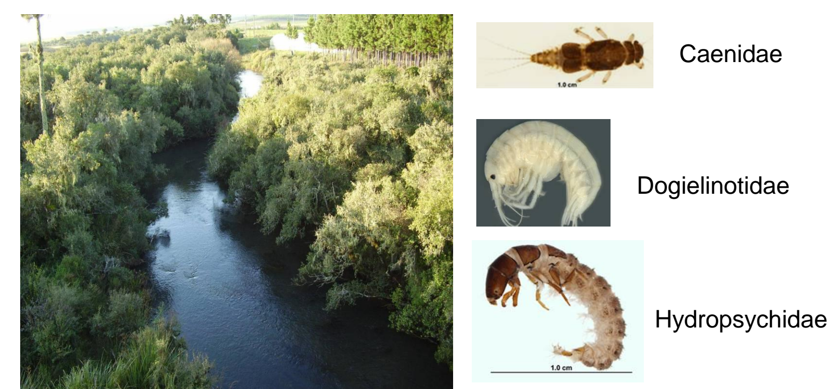
Figura 4: Rio Tainhas (Cambará do Sul) –Integridade regular