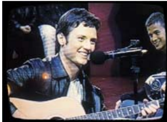
Cena da cantada