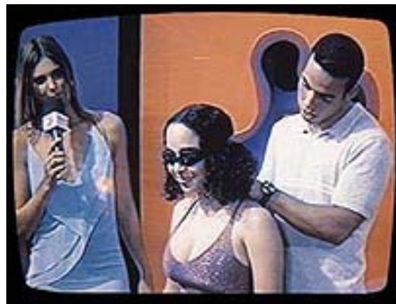
Cenas do momento sensorial