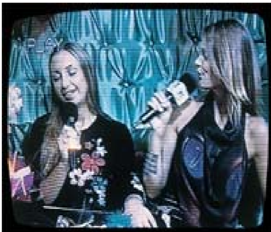
Cena da etapa dos presentes