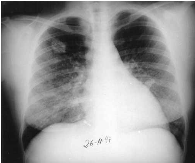
Figura 3 – Caso 2: Na radiografia de tórax (nov/97) observa-se lesão nodular escavada no lobo superior direito.

meros acúmulos de macrófagos com necrose central (granulomas com supuração central). Por vezes, as áreas de necrose eram confluentes. Havia ainda fibrose intersticial, edema alveolar e membranas hialinas recobrando alvéolos e ductos. Os demais órgãos do bloco torácico, abdominais e cavidade craniana não mostraram alterações dignas de nota.