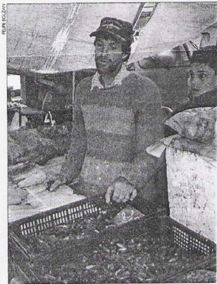
Sangoi já participa das feiras há 10 anos

Além disso, os produtores passaram a apagar impostos que regularizaram a sua localização,