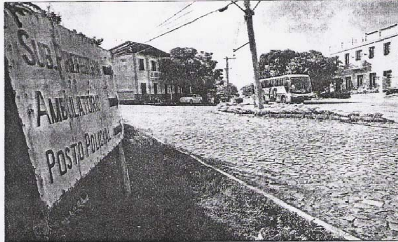
Arroio Grande, distrito que teve colonização italiana, impressiona pela beleza e pela boa qualidade de vida

Em Arroio Grande, o asfalto chega à sede. Traz junto o turista, que pode comprar produtos coloniais e encher a barriga na farta gastronomia italiana. Ali ficam também as três indústrias de facas. São só 6 quilômetros até o Camobi.