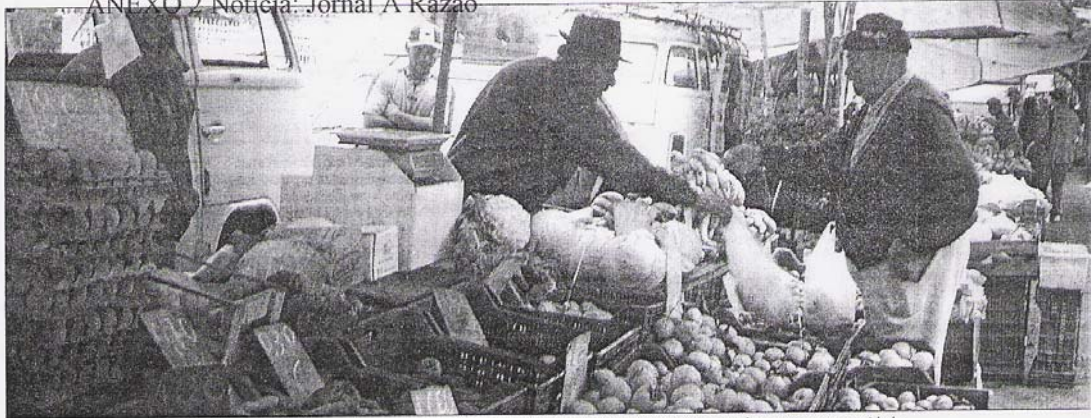
Cerca de 150 feirantes já estão cadastrados no Município para expor seus produtos nas feiras existentes na cidade