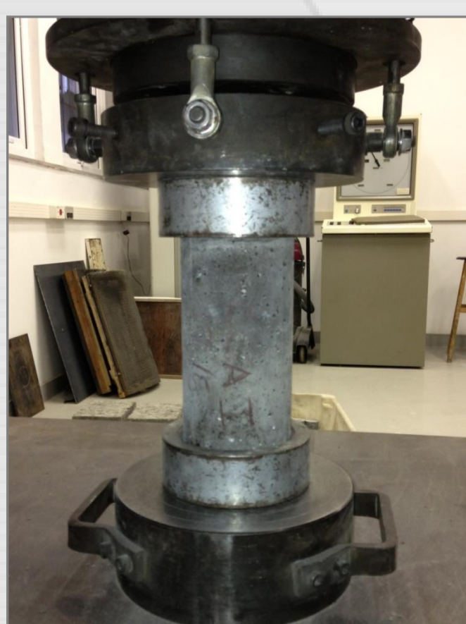
Ensaio de resistência à compressão axial