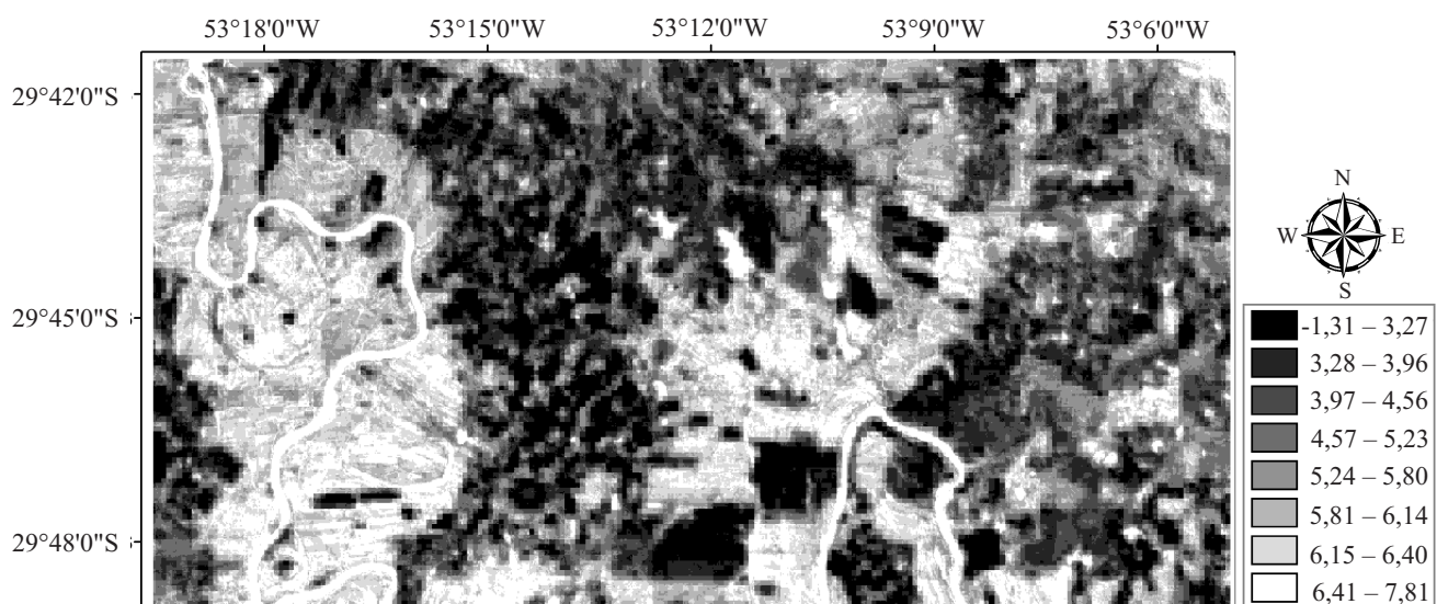
Figura 3. Distribuição espacial da evapotranspiração (mm dia -1 ), no dia 4 de março de 2004.

As áreas de solo exposto, marcadas com a cor preta na imagem, apresentaram os menores valores de ET, com valores inferiores a 3,96 mm dia -1 . As áreas com vegetação nativa presente, destacadas em tons médios de cinza na imagem, apresentaram valores de ET entre 3,97 e 5,80 mm dia -1 . Nos casos em que há disponibilidade de água na superfície, a tendência preferencial de consumo de energia do R_n é na forma de calor latente. Em estudo sobre uma região que apresentava cobertura vegetal muito heterogênea no Sri Lanka, Hemakumara et al. (2003) obtiveram valores diários de 3,0 a 4,0 mm, com uso de um cintilômetro de grande abertura. Em estudo no Novo México, na região de Las Cruces, composta por desertos e áreas de culturas irrigadas, Wang et al. (2005) aplicaram o algoritmo SEBAL adaptado a imagens ASTER e obtiveram, em áreas com cultura irrigada, valores de ET na faixa de 4,9 a 5,9 mm dia -1 . As massas de água representadas na Figura 3 mostram valores diários de ET entre 6,41 e 7,81 mm dia -1 . Allen et al. (2005), com auxílio do modelo METRIC, similar