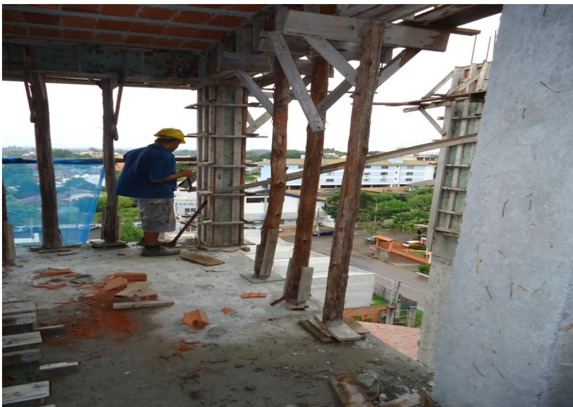
Figura 1 – Trabalho exposto ao risco de queda