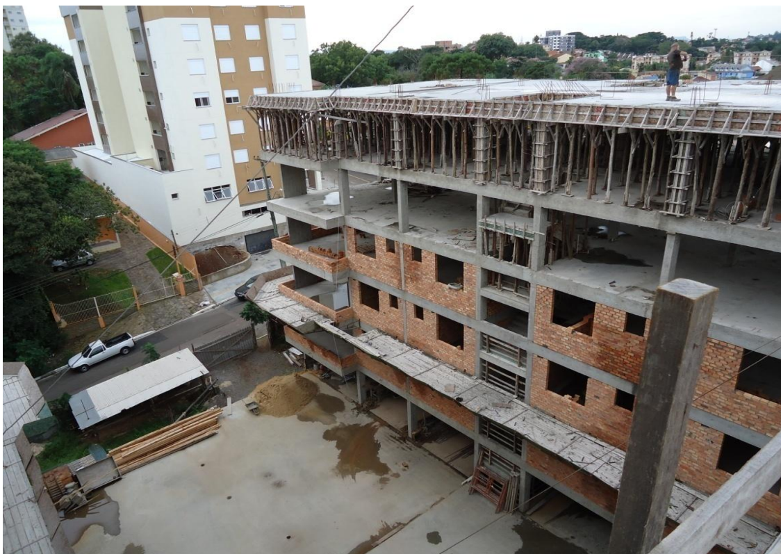
Figura 4 – Instalação de plataforma somente na segunda laje Torre A