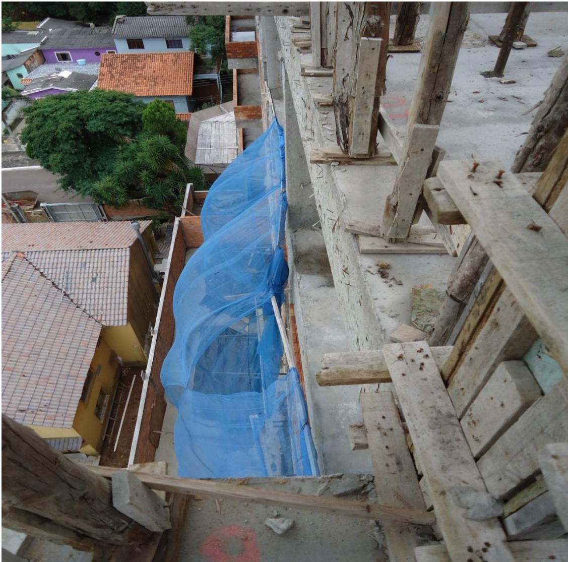
Figura 6 – Precariedade de alguns elementos de proteção

Na figura 6 foi evidenciada a precariedade da instalação das telas e a inexistência da continuidade das mesmas e falta das madeiras das plataformas de proteção contra quedas.