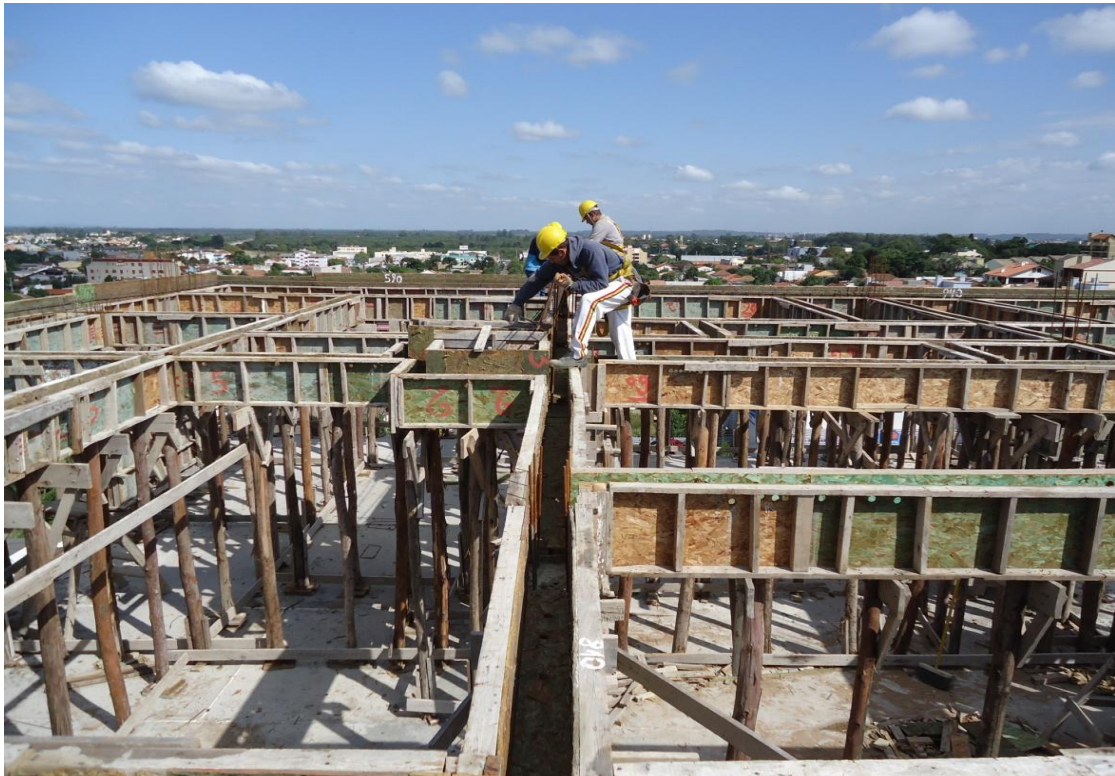
Figura 2 – Perigo no trabalho em periferia com risco de queda