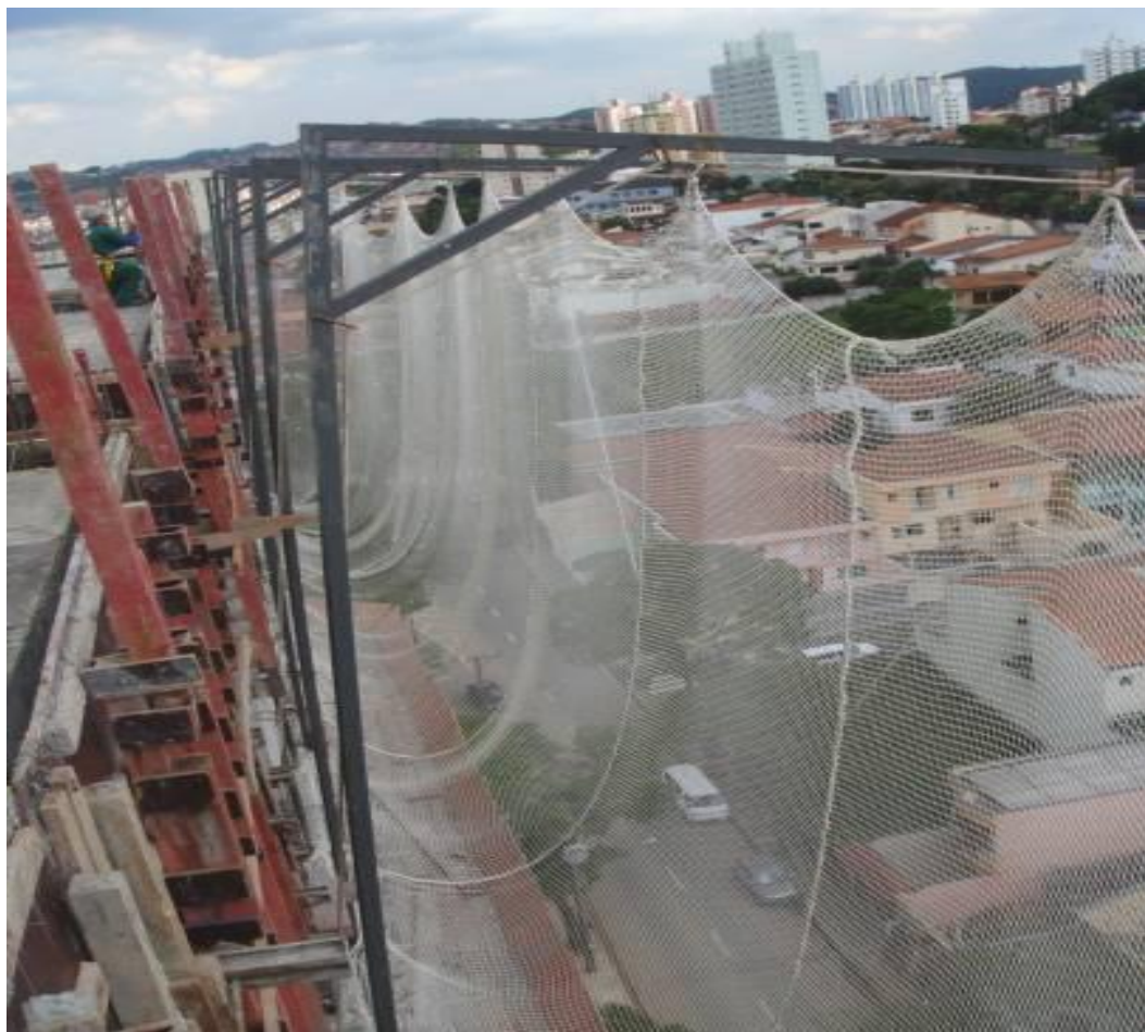
Figura 8 – Rede de proteção contra quedas

Conforme demonstrado na figura 6 o sistema de sustentação da rede do tipo forca pode ser utilizado.