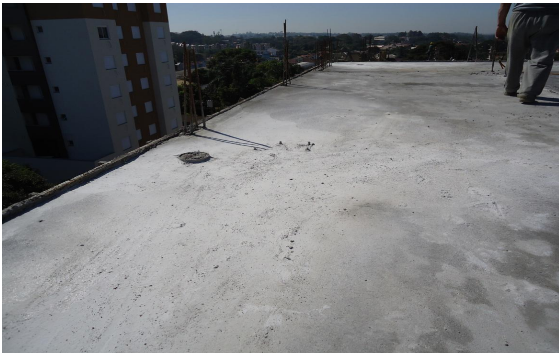
Figura 3 – Trabalho em periferia com risco de queda