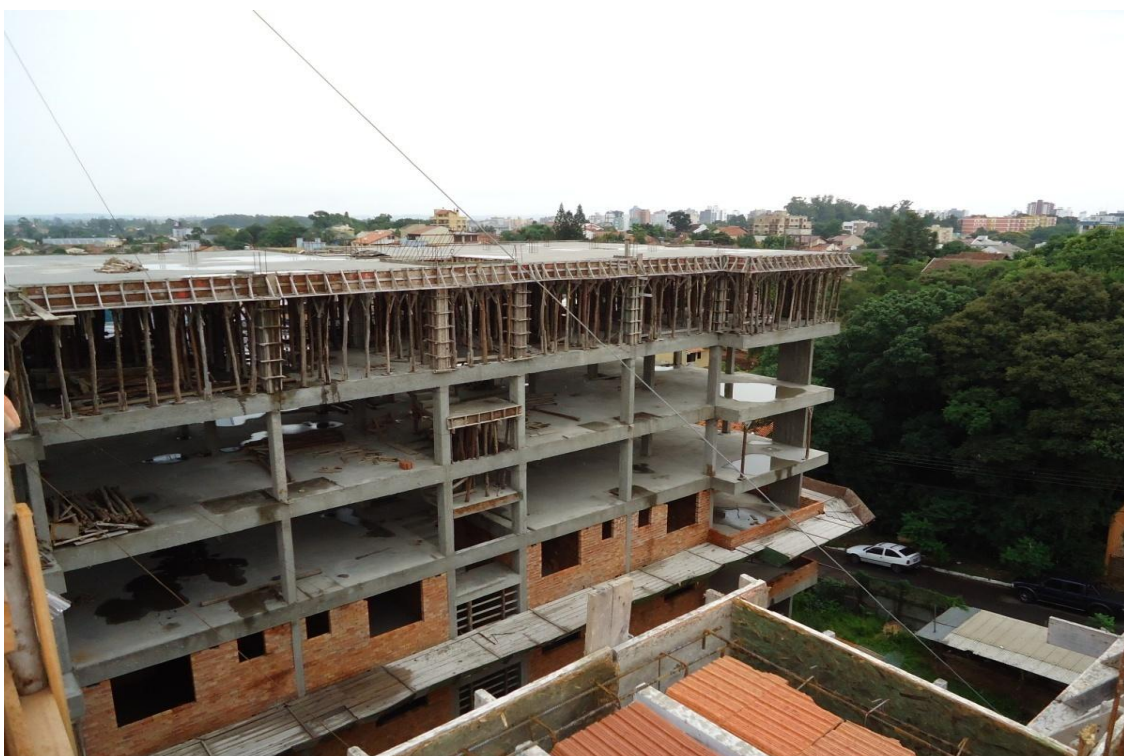
Figura 5 – Instalação de plataforma somente na segunda laje Torre B