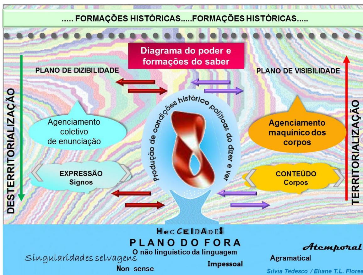
Figura 2. Diagrama do poder e formações do saber. Trabalho realizado durante o doutorado com Silvia Tedesco.