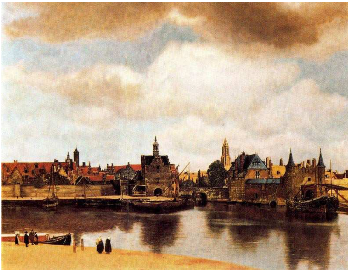
Figura 5 - A vista de Delft (Johannes Vermeer 34 ), indicado, por diversos críticos, como o quadro “mais belo do mundo” segundo o parecer de Marcel Proust, opinião compartilhada, na Recherche , pelo escritor Bergotte e pelo narrador Marcel

Às representações estéticas refinadas (nas artes plásticas, na literatura, na música, etc), Marcel associa a mesma “realidade espiritual” evocada pelas manifestações involuntárias mais significativas de sua narrativa, todas elas símbolos do prazer originado pela busca incessante de “profundidade” e da “verdade”, busca baseada na “realidade da memória” revivida através do apelo à arte e aos sentidos, pois