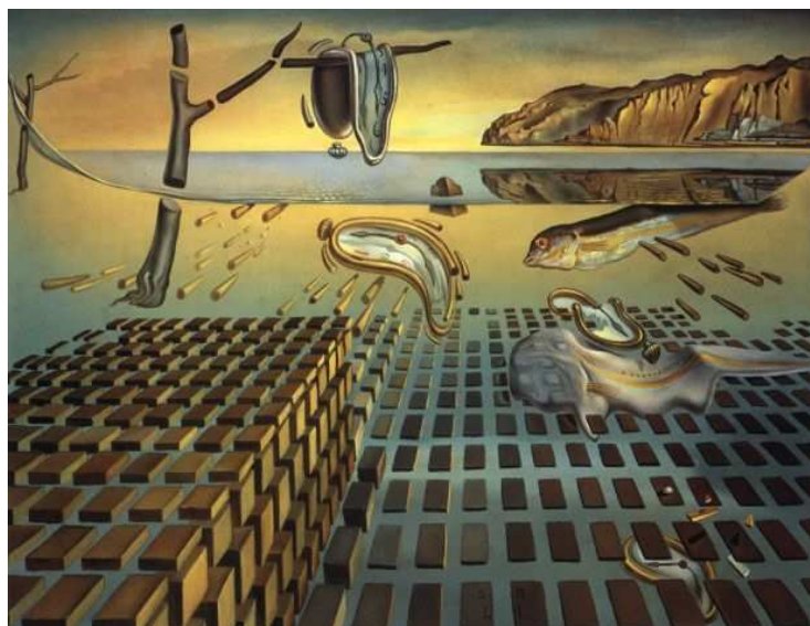
Figura 3 - A desintegração da persistência da memória (Salvador Dalí)

Destruição que nos é apresentada em um óleo sobre tela de 1954 (posterior, portanto, ao fim da 2ª Guerra Mundial e às bombas atômicas sobre Hiroshima e Nagasaki 47 ): trata-se de A desintegração da persistência da memória ( La desintegración de la persistencia de la memoria ), experiência ainda mais iconoclasta que a primeira, na qual as “profecias” anteriormente anunciadas pelo pintor se concretizam: desta vez não há mais remédio – as armas nucleares destruíram não apenas os humanos mas o lugar que eles ocupavam, a Terra se desagrega aos poucos, conseqüência funesta de um fim anunciado, oliveira, rochedo, caricatura e relógios começam a se desintegrar, até tornarem-se um mesmo Nada, matematicamente dissolvidos em formas geométricas terrivelmente inóspitas e indiferentes.