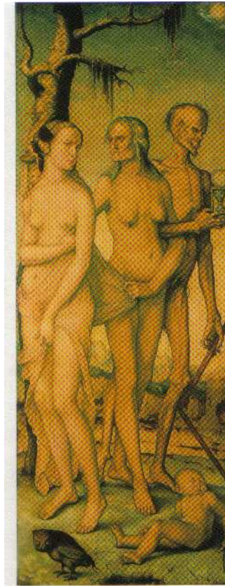
Figura 1 - As três idades do homem e a Morte (Hans Baldung)

presságio. Ou seja, levamos a vida inteira para nos conhecermos melhor mas no final inevitavelmente morremos, completando um ciclo que não admite exceções ou variações à regra. Esta é a verdade sombria que nos apresenta o artista em traços vivos de nus que denotam o realismo dos corpos caracterizados e das mensagens subliminares: