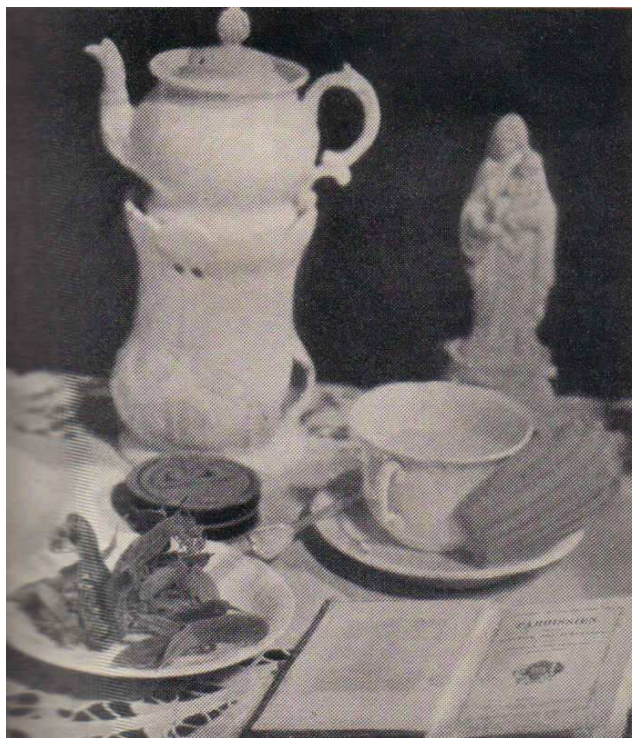
Figura 4 – O “gatilho” da memória involuntária em Proust: o chá e a madeleine

Em “Le bas couleur de bruyère”, ao discorrer sobre os componentes psicológicos e subjetivos que movem as produções de Virginia Woolf e de Marcel Proust, porta-vozes de uma profunda e gradual “espiritualização do objeto” 116 e conscientização de suas potencialidades, dados que se refletem na maneira como as obras são concebidas e realizadas, Erich Auerbach destaca a manifestação da memória involuntária em A la recherche du temps perdu , desencadeada por um “acontecimento sem importância e aparentemente fortuito”, como o fator responsável pela tomada de consciência, por parte do narrador, da necessidade de reencontrar o “tempo perdido” e de reelaborar sua significação: