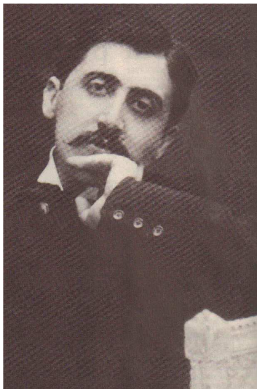
Figura 6 – O “zaori” Marcel Proust

Se Proust possuía o “sexto sentido” do zaori, imaginemos o quanto ele dominava com maestria os cinco sentidos habituais, dos quais extraiu os alicerces com os quais construiria seu “edifício imenso da recordação”. Augusto Meyer percebe bem o quanto Proust sobrepunha outros criadores geniais, já que o romancista francês, além da inteligência, gozava