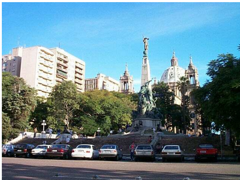
Figura 9 – Praça da Matriz nos dias de hoje (século XXI) – notar o obelisco ao centro e a Catedral Metropolitana (Igreja Matriz de Porto Alegre) ao fundo

Da mesma forma que em relação ao rancho e à várzea da campanha, o memorialista, ao evocar seus pontos prediletos da capital, obedece ao “traçado de uma planta subjetiva” que reorganiza o mapa de uma “paisagem interior” (recriada pela imaginação e pelos acessos involuntários), depõe o “moderno” e sacraliza o “tradicional”, procedendo a um rigoroso processo de exclusão e de inclusão das imagens que a ele interessa destacar: arranha-céus, avenidas e obeliscos caricaturais são alijados de suas reminiscências e romanticamente substituídos por becos, vielas, praças e chafarizes “imortais” e “congelados” na “Hora Adormecida no Tempo”, reconstituídos com o fim específico de dar margem à ilusão de que o tempo parou de vez “nas mesmas casas e ruas” de algumas “ladeiras de recordações” (1966, p. 139) – “cem anos” do “beijo do príncipe” ou da “flor de lótus” a propagar a inércia e a captar, no “instantâneo fotográfico”, o belo, o simples e o eterno. Dessa maneira, temos não somente um “espaço ideal” (o pays de tendre meyeriano composto pelo Cerro e pela capital gaúcha antes da modernização), mas também um “tempo ideal” (a juventude, “tempo da flor”, eternizada nas Memórias ).