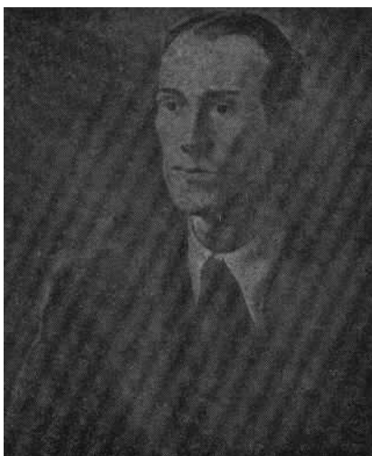
Figura 7 – Augusto Meyer em óleo de Portinari

Esclarecidas as divergências filosóficas e comportamentais, resta a Tristão resumir a importância de Meyer para a literatura brasileira, uma vez mais ressaltando a excelência do conjunto de sua obra e se somando às opiniões de Josué Montello, Guilhermino Cesar, Paulo de Gouvêa e Carlos Dante de Moraes no reconhecimento de sua maestria e preeminência: