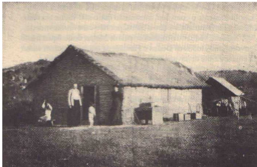
Figura 10 – Cerro d'Árvore, “tempespaço” reinventado

A memória da infância é uma ilha perdida. Navegando para lá, não sei por que, lembro-me Fabini e a “isla de los ceibos”. A mesma incerteza dos compassos iniciais; depois, o mesmo clarão de descobrimentos imprevistos.