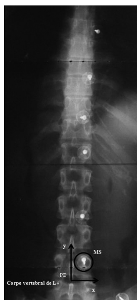
Figura 1. Imagem radiológica da coluna vertebral no plano frontal, em decúbito lateral direito. As setas indicam sistema de coordenadas cartesianas (x, y), em que o centro do Processo Espinhal serve como origem

Os Processos Espinhosos das vértebras C7, T2, T4, T6, T8, T10, T12, L2, L4 e S2 foram identificados, por meio do método palpatório, e demarcados com marcadores de chumbo, estando o indivíduo na posição ortostática (PO). Levando em consideração que o método palpatório é dependente da experiência do avaliador 25,29,30 , os procedimentos de palpação foram realizados por um único fisioterapeuta, com sete anos de experiência na prática clínica em demarcação de pontos anatômicos. Imediatamente após a marcação dos PE, os indivíduos foram submetidos no mesmo dia e local a dois exames de raios X da CV, um na PO e outro em decúbito lateral direito (DLD), ambos no plano frontal com incidência posteroanterior. O primeiro exame de raio X foi realizado na PO, no qual o indivíduo foi posicionado em pé de frente para o chassi, com os membros superiores relaxados ao longo do corpo e com o peso corporal distribuído igualmente entre os membros inferiores. Imediatamente após, para realizar o segundo exame de raios X, o participante foi instruído