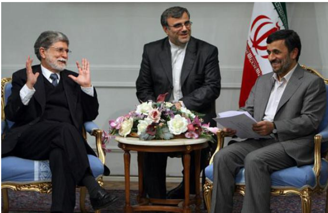
O chanceler Celso Amorim em encontro com o presidente iraniano, Mahmoud Ahmadinejad

27/04/2010 às 18:21 - Atualizado em 29/04/2010 às 17:46