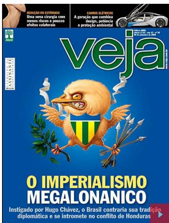
Fig.5: Imperialismo megalonanico 102

Um último tema que quero destacar nesse transversal exame dos comentários são as glosas que tratam mais especificamente da diplomacia brasileira. Entre a utilização de vocábulos rebuscados e a criação de neologismos, Azevedo cunhou um vocábulo que serviu, junto a suas variações, para a definição da PEB para Veja até o final do mandato de Lula: megalonanico . Neste espaço, a definição é relacionada ao mandatário e aos diplomatas (“ embaixadores megaloidotas ”), mas é possível dizer que a definição é usada de forma ainda mais abrangente: para explicar a Política Externa Brasileira.