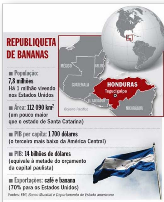
Fig. 3: Republiqueta de bananas 92

Afirma-se que a grande colheita do produto deu origem à expressão, que obviamente é relacionada a uma suposta falta de seriedade institucional. Embora objetivamente a interferência de empresas norte-americanas – em especial a United Fruit Company – tenha fomentado problemas políticos, subjetivamente o termo bananas adquire o significado de bagunça. Historicamente, acabou-se por se relacionar a quaisquer dificuldades enfrentadas pelos países da América Latina – em grande medida, incorrendo em efeito humorístico. A questão é que esta tipificação sustenta e é sustentada pela concepção de que repúblicas consideradas “bananeiras” não devem ser levadas a sério 93 , pois as instabilidades políticas fazem parte de “sua natureza”.