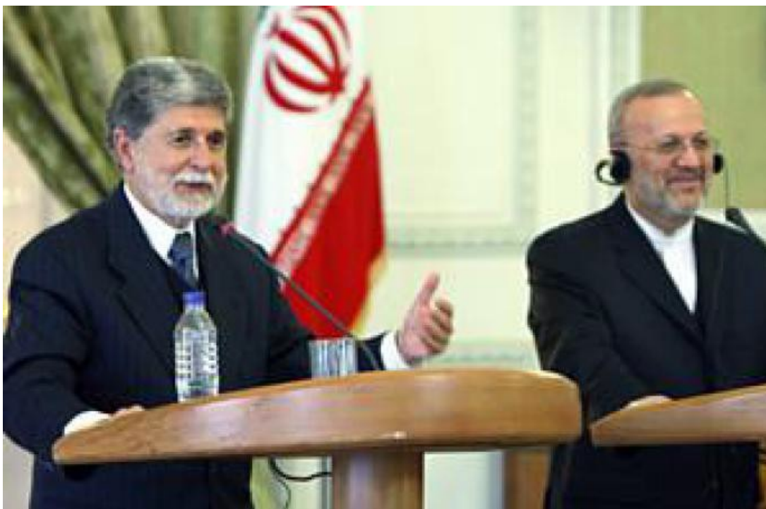
O ministro Celso Amorim se reúne com o chanceler iraniano, Manouchehr Mottaki

27/04/2010 às 18:48 - Atualizado em 29/04/2010 às 17:46