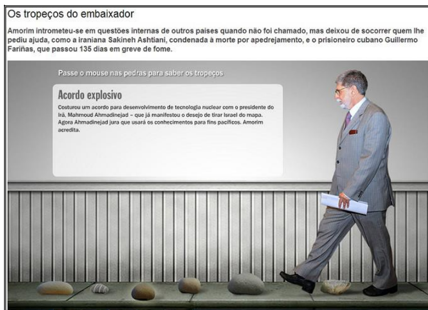
Fig. 6: Os tropeços do embaixador

A desqualificação do trabalho de Amorim é, por certo, uma tentativa de atingir o capital adquirido em âmbito doméstico pelo ministro ao longo dos dois mandatos. É necessário sustentar que a tese de que o trabalho de Amorim é fraco, pois apesar da presença marcante da imagem de Luiz Inácio Lula da Silva à frente das ações, o chanceler é o articulador da PEB. Desta forma, as estratégias de inserção global arquitetadas são noticiadas como “não-estratégias”, pois Amorim está sempre perdido entre a megalomania e a ingenuidade de Lula e manipulação de Chávez. A cobertura realizada sobre a composição dos BRICS, por exemplo, cita o ministro apenas uma vez, deixando completamente invisível tanto sua atuação quanto a do próprio Itamaraty na constituição de um grupo que reúne países da magnitude de China, Rússia, Índia e África do Sul. Escamotear Amorim e o MRE nesse processo é uma escolha editorial de clara intenção político-econômica.