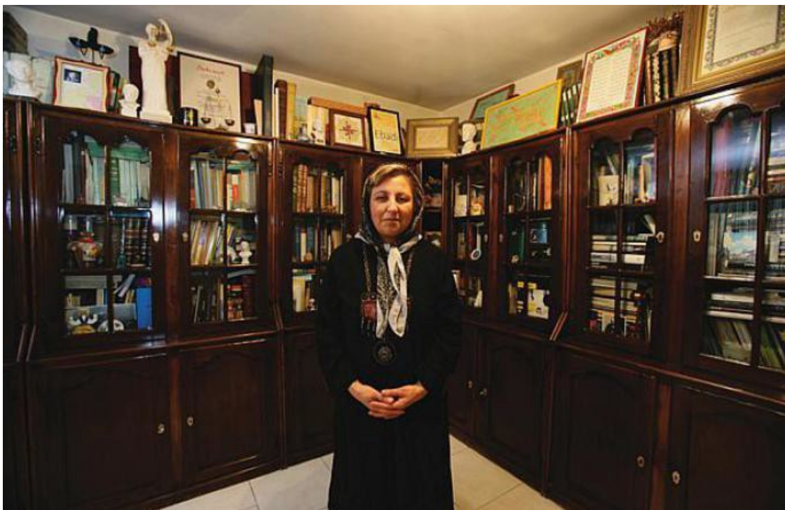
Shirin Ebadi: "Por que Lula não visitou líderes de sindicatos nas prisões?"

Por: Cecília Araújo 10/06/2010 às 11:31 - Atualizado em 11/06/2010 às 21:21