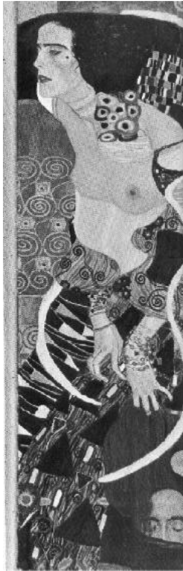
Figura 2. Gustav Klimt. Judite (II) - 1909. Galeria d'Arte Moderna, Veneza.

Como bem sabes, acabei modificando minha linha de pensamento, pois, por volta de 1939, já compreendera que não apenas a sexualidade, mas a vida enquanto tal é regida por um padrão orgiástico ao qual denominei Orgone . Se a hipótese da eletricidade apresentava-se mais fácil a uma eventual aplicação