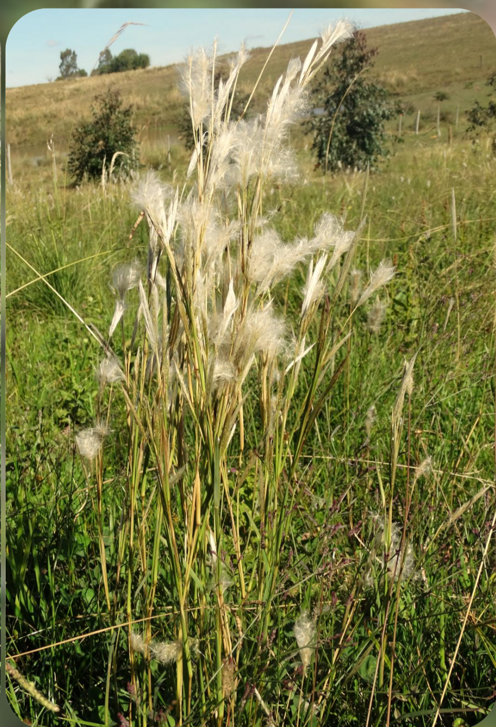
Figura 2: Bothriochloa laguroides ;