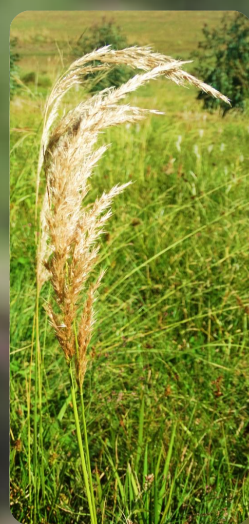
Figura 5: Calamagrostis viridiflavescens ;