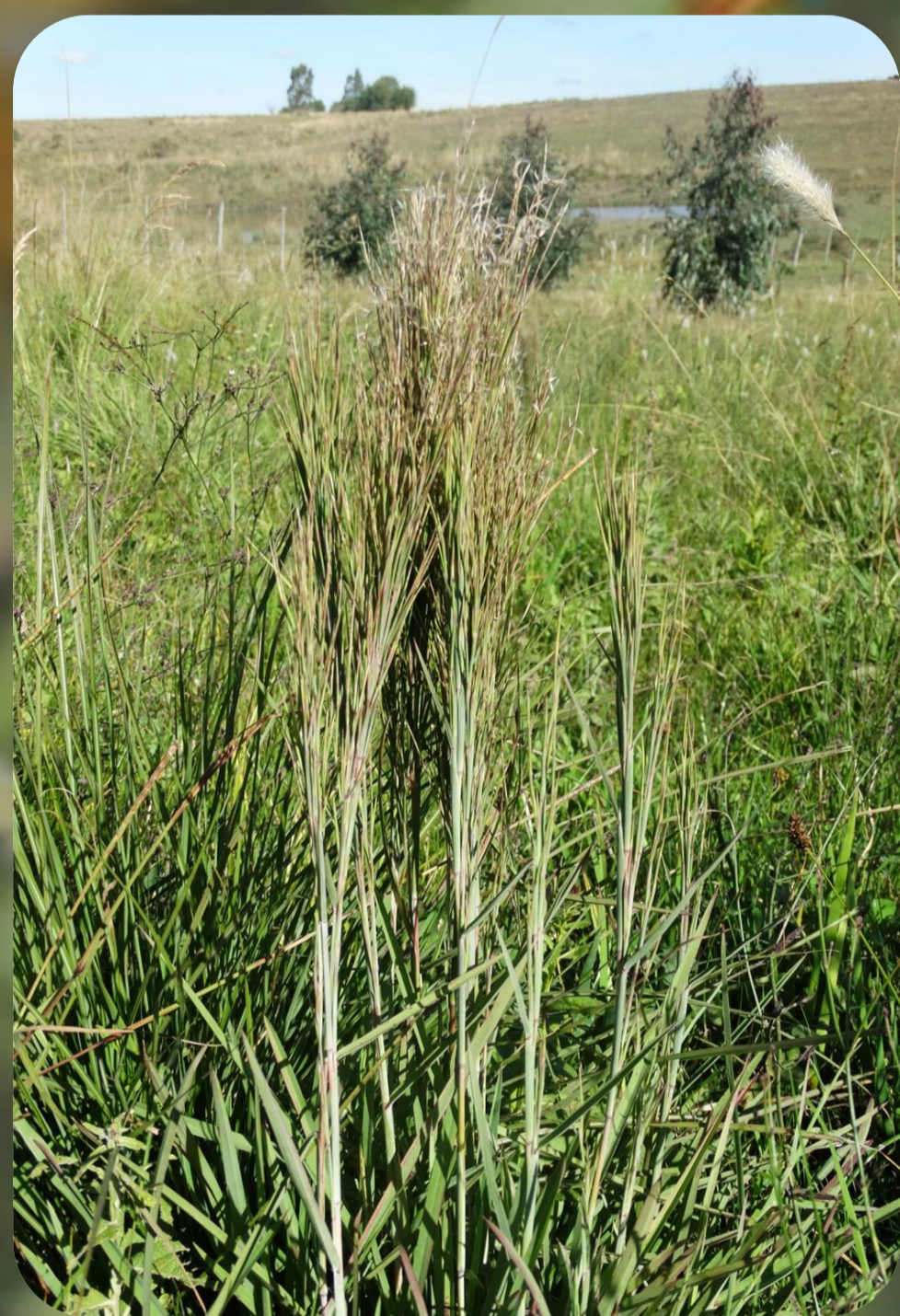
Figura 1: Schyzachirium microstachyum ;

O objetivo deste estudo é avaliar o potencial de recuperação de uma área utilizada durante 20 anos para a agricultura e comparar essas informações com área testemunha de campo nativo sob ação de pastejo.