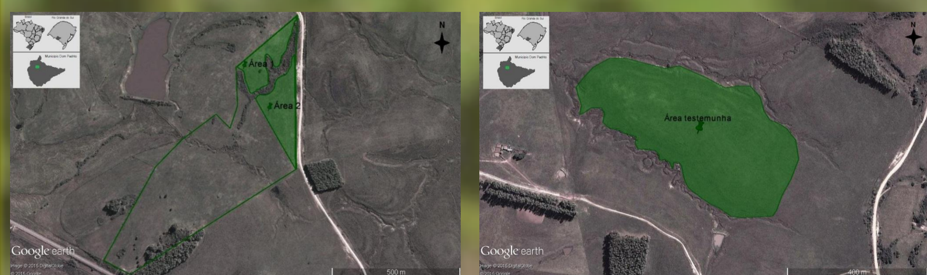
Figura 3: Localização da área de estudo; Figura 4: Localização da área testemunha.