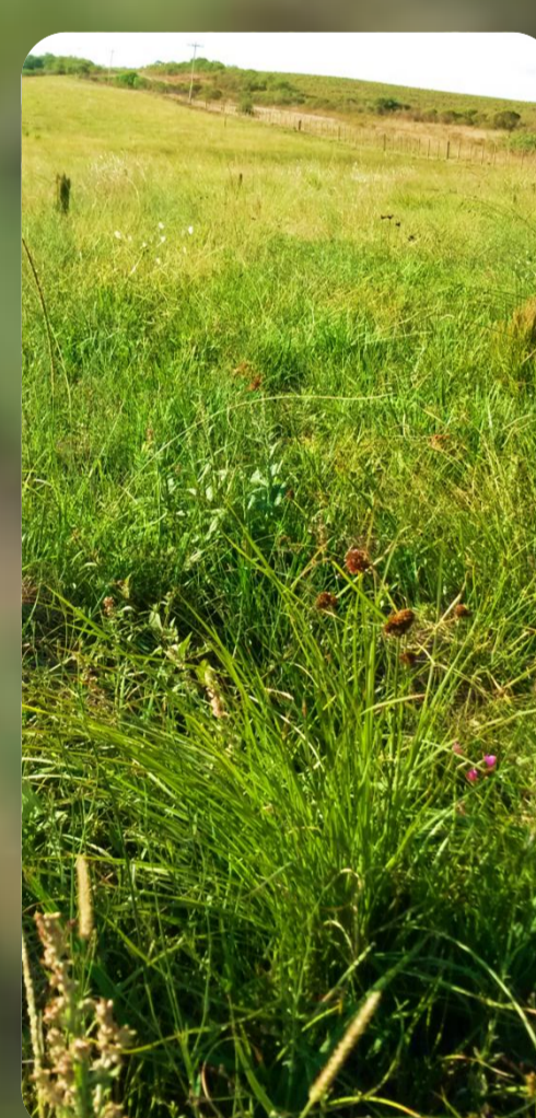
Figura 7: Cyperus sp.