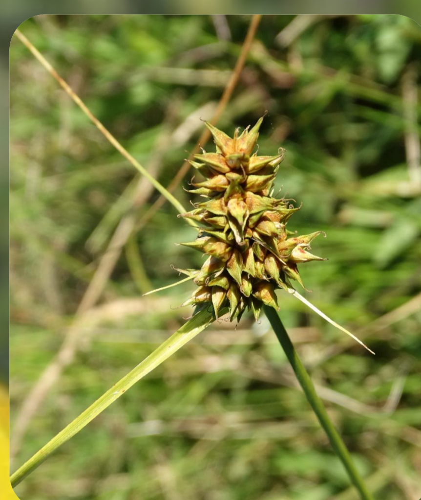
Figura 6: Carex sororia ;