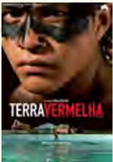
Terra vermelha (Marco Bechis, 2008)