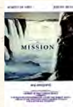
A missão (Roland Joffé, 1986)