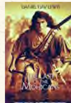
O último dos moicanos (Michel Mann, 1992)