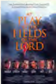
Brincando nos campos do Senhor (Hector Babenco, 1991)