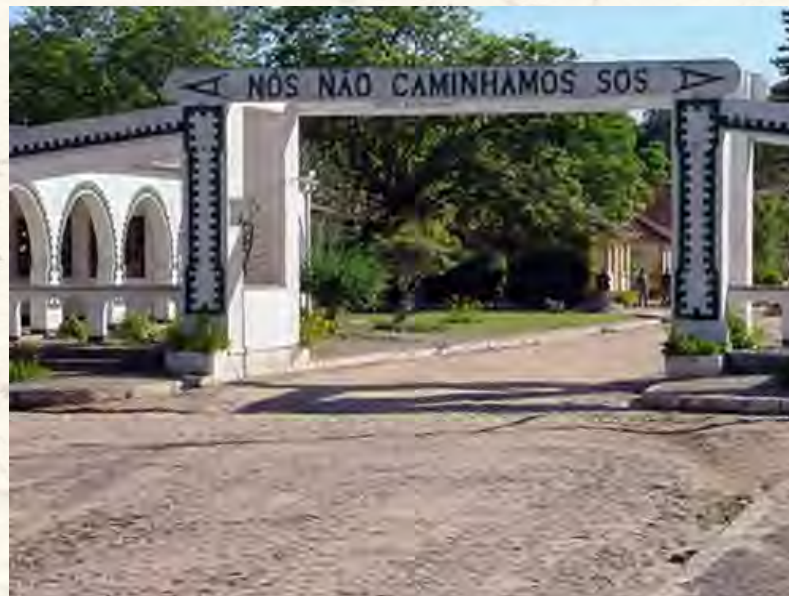
Cinema e fotoetnografia na cidade dos condenados.

A foto a seguir mostra o portão de acesso do Hospital Colônia Itapuã em Porto Alegre: “nós não caminhamos sós” é o chamamento para que se possa pensar na exclusão e no estigma.