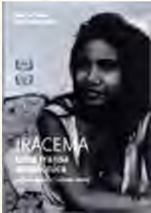
Iracema - uma transa amazônica (Jorge Bodanzky e Orlando Senna, 1974)