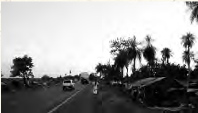
Luta de Guarani-Kaiowás por sobrevivência na beira de estradas.

Quando chove, a lama escorre dentro das barracas e eles precisam colocar pedras ou tijolos para pisarem, caso contrário os pés ficam enterrados na lama. Também precisam colocar os móveis e utensílios sobre pedras para não molhar as roupas. Felizmente tem o rio perto, onde eles tomam banho e se refrescam e as crianças, que mesmo com tão pouco, ficam felizes.