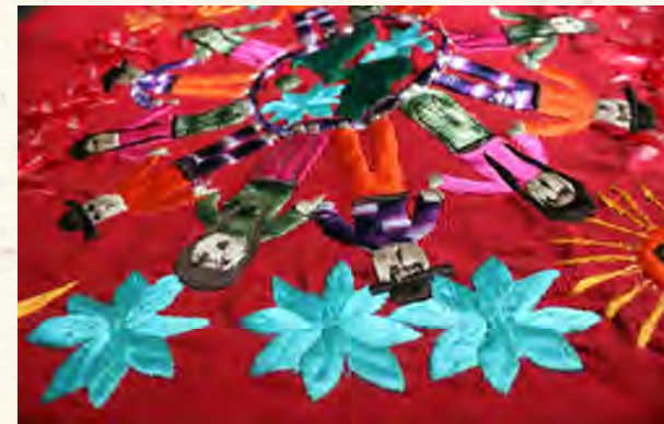
Povos do mundo. Detalhe de um bordado do povo maia.

Paremos só um minuto para pensar de onde vieram nossas famílias e qual o caminho percorrido para chegar no Brasil.