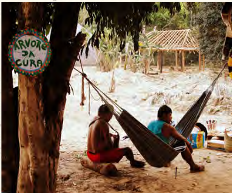
A árvore de cura (Foto: Vatsi Danilevicz).