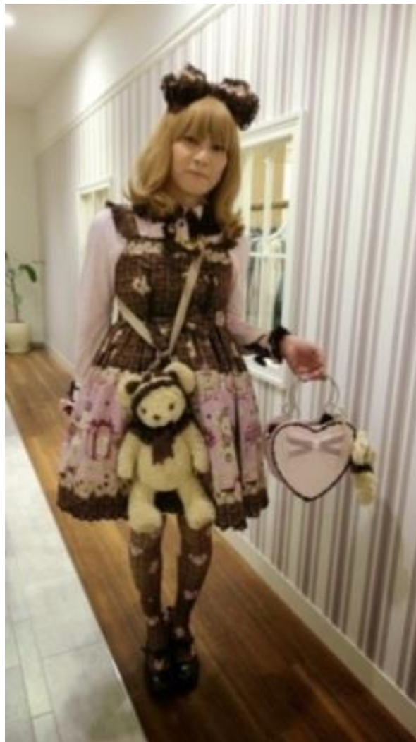
Figura 4: O brolita Onpu-chan em seu traje sweet , durante festival em Tóquio. 22

Sweet: modalidade “mais meiga” e “mais infantil”, com mais babados, mais rendas, mais volumes. Distingue-se da silhueta classic pela saia em forma de sino – ou U invertido. Apregoa tons pastel, branco, preto e vermelho. As estampas se caracterizam pela prevalência de bichinhos e de comidas (biscoitos, cerejas, morangos, sorvetes, cupcakes ), xícaras, cartas de baralho, além de notas musicais, xadrezes, bolinhas e outras. O outfit inclui bichos de pelúcia ou em forma de bolsas, não raras vezes com tiras longas atravessadas no corpo, liberando as mãos para brinquedos ou bonecas. Na cabeça, pode haver grandes topos, pequenos chapéus e enfeites, como bolos. Nos pés, sapatos ou sapatilhas de bicos arredondados e com laços. Saltos podem ser grossos ou plataformas. 21