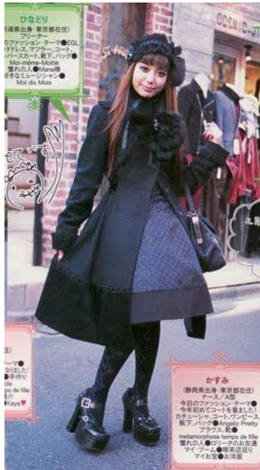
Figura 5: Editorial de moda com variação do subestilo gothic. 24

Gothic: preto predomina, mas azul-escuro, branco, vermelho, cinza e bordô participam dos outfits . Quando há estampas, estas normalmente remetem a morcegos, relógios, caixões, crucifixos. A saia normalmente segue o formato sino, com comprimento até os joelhos. É o subestilo em que aparece o corset . Nos pés, sapatos e botas tendem a ser lisos, com plataformas e saltos quadrados. Bolsas em formatos inusitados, como caixões, costumam ter alça curta e ser portadas como maletas. 23