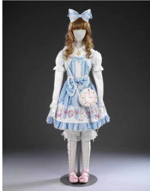
Figura 13: Outfit Baby, the Stars Shine Bright , do Museu V&A, de Londres. 31

dedicada à moda urbana japonesa, onde há alguns exemplares desse vestuário, as manequins vestidas com outfits têm pés e joelhos voltados “para dentro”. E mais: há semelhanças entre o desenho de Heidi – que, àquela época, desconhecia a presença das roupas Lolita no acervo do museu – e uma das composições expostas na instituição britânica.