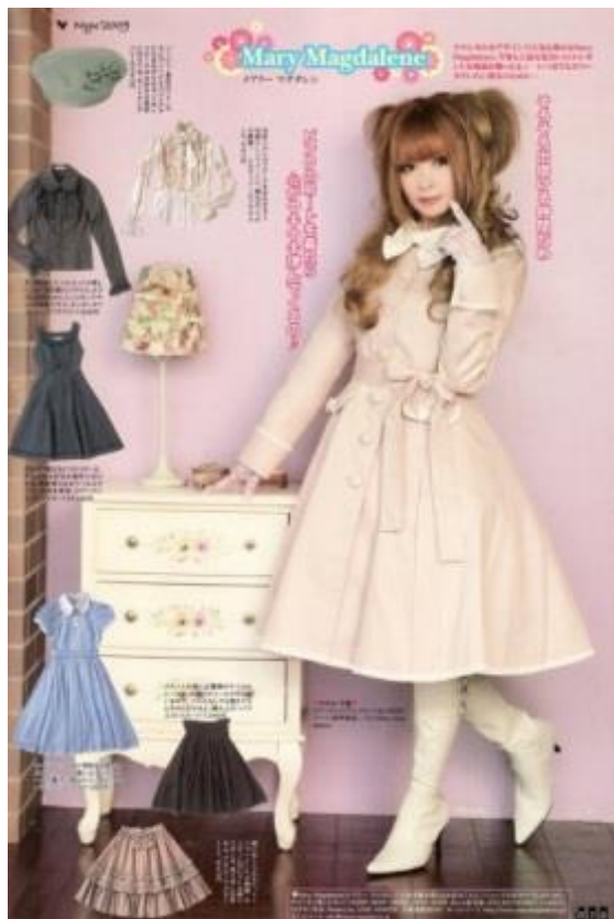
Figura 3: Subestilo classic em anúncio da brand Mary Magdalene. 20

Classic: a saia costuma seguir o formato A-line. Predominam vestidos de estampas florais ou de frutas em cores claras – como rosa, bege e cinza –, e os comprimentos podem passar do joelho. Cabelos lisos ou cacheados, longos ou curtos e, normalmente, em cores naturais são amarados com fitas ou adornados por adereços de cabeça. Pérolas, camafeus, relicários e rosas são alguns itens que constam dos acessórios. As bolsas vêm em tamanhos pequenos, às vezes enfeitadas com topes, e suas alças, curtas que são, exigem ser carregadas numa das mãos, na frente ou na lateral do corpo. Podem-se usar sapatos de bico redondo ou botas “vitorianas”. Admitem-se saltos finos. Seria o subestilo mais “elegante”, “sóbrio” e “discreto” para usar alguns adjetivos colhidos em campo. Também é chamado de classical . 19