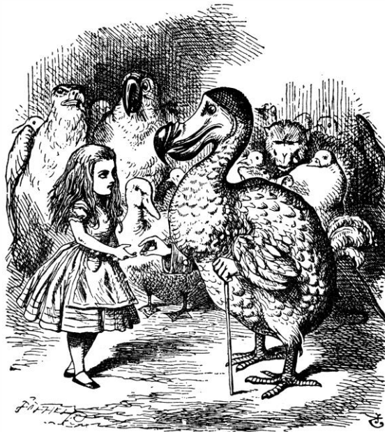
Figura 6: Alice no País das Maravilhas, por John Tenniel. 25

provocando emoções, tensões e inquietações que fluem de Harajuku para outros locais habitados por adeptas e adeptos da moda até os dias de hoje.