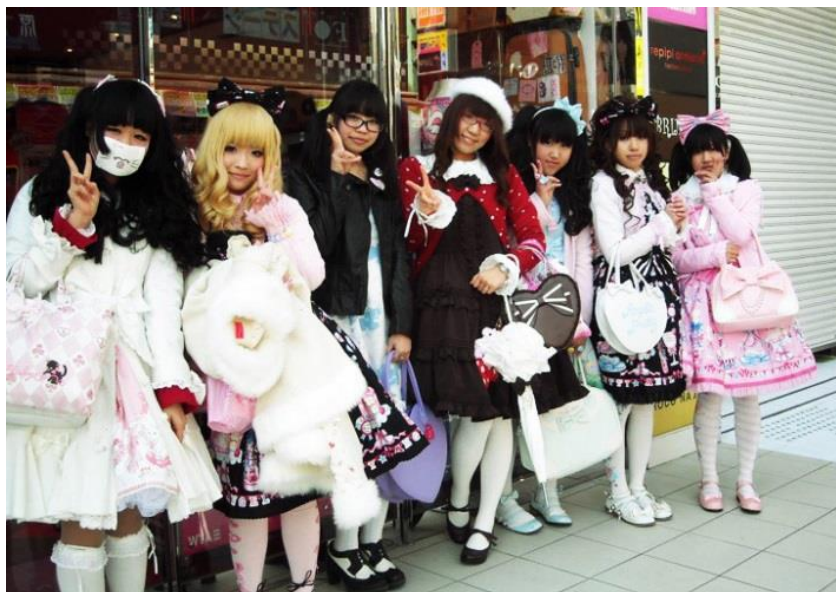
Figura 2: Lolita no bairro de Harajuku, no Japão. 12

Dos trajés, saltam fitas, rendas, tules, veludo, algodão e tricoline em composições montadas para disfarçar aspectos da silhueta adulta, como busto e quadris. Ainda assim, marca-se a cintura. O comprimento das saias deve partir da altura do joelho em direção aos tornozelos. É raro, pelo menos no Japão, ver braços, ombros, colo e costas descobertos.