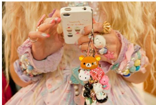
Figura 1: Composição kawaii. 10

Entusiastas – mulheres, na maioria – ocupam as ruas portando roupas com fitas, babados, saias armadas por anáguas, meias, sapatos “de boneca” ou botas, perucas, cílios postiços e sombrinhas, entre outros adornos, seguindo guidelines 9 nada estáticas, muitas vezes desafiadas, adaptadas e usadas para marcar visualmente, por meio da composição, fronteiras entre quem é e quem não é lolita. Ressalto que, apesar de serem usados majoritariamente por adolescentes e pessoas na faixa dos 20 anos, esses figurinos não celebram esses grupos etários. Por meio dos outfits e de performances corporais, há a exultação da fase infantil, com profusão de estampas de pirulitos, castelos e unicórnios, apenas para citar algumas, mangas bufantes, brinquedos, bonecas e bichos de pelúcia.