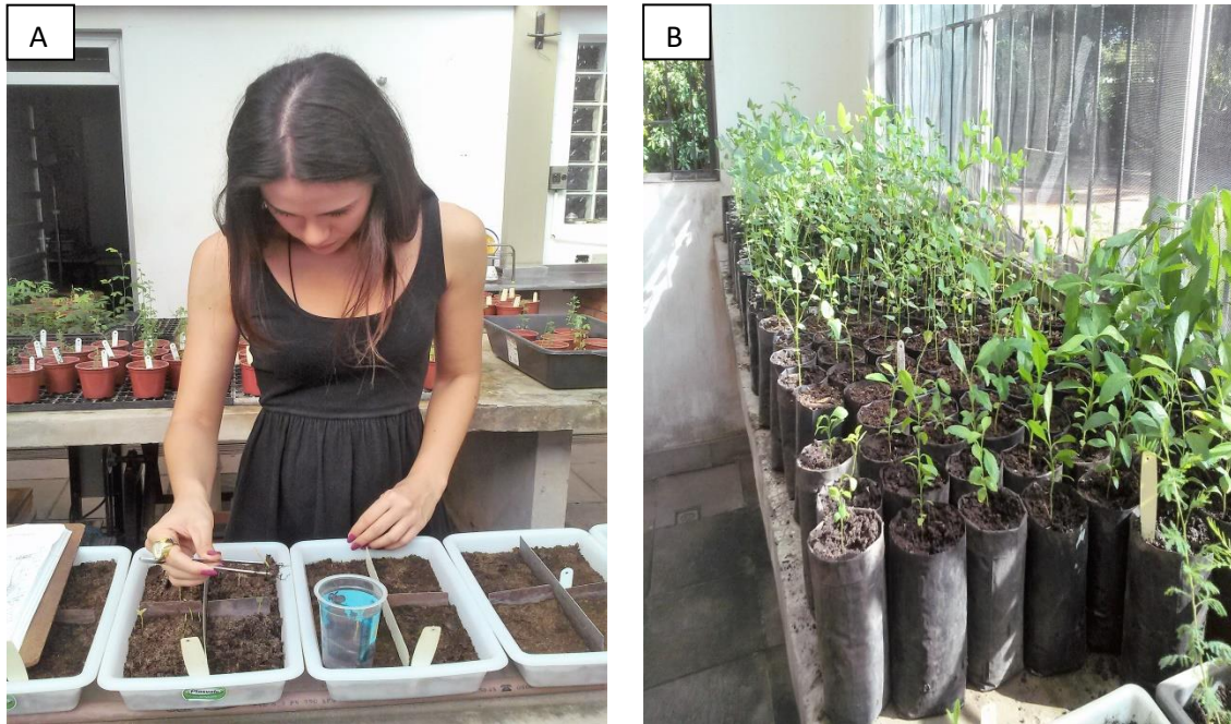
Figuras 9– Repicagem das plântulas (A); mudas destinadas ao viveiro do JB(B). Jardim Botânico. Porto Alegre (RS), 2018