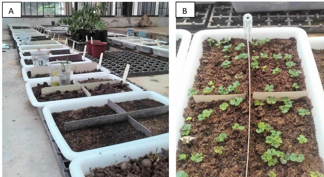
Figura 8 – Bandejas dos testes semeados(A) e com emergência de plântulas (B), na casa de vegetação. Jardim Botânico, Porto Alegre (RS),2018