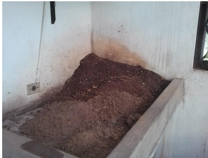
Figura 11– Substrato (composto orgânico) das mudas destinadas ao viveiro exposto na bancada

análises efetuadas em laboratório contribuem para a escolha do substrato apropriado para determinada espécie, que contribuirá para o manejo e a fase de desenvolvimento desta (FERMINO, 2003). Especificamente, os substratos utilizados nos testes de germinação apresentam enorme influência na germinação da semente: fatores como aeração, retenção de água, estrutura e nível de infestação de patógenos depende do material utilizado (BECKMANN-CAVALCANTE et al., 2012). De acordo com os mesmos autores, os substratos areia, fibra de coco e vermiculita são comumente empregados nas fases iniciais do desenvolvimento e crescimento de plântulas.