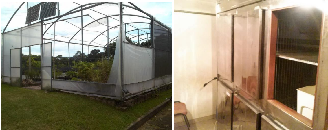
Figuras 10 – Viveiro utilizado para a produção de mudas de espécies nativas danificado (A); câmara fria úmida armazenadora de espécies recalcitrantes defasada (B). Jardim Botânico. Porto Alegre (RS), 2018

equipamentos de germinação com a distribuição de luz adequada para identificar o comportamento da semente em relação a iluminação, principalmente para espécies nativas que não possuem quantidade significativa de dados na literatura. Além disso, no setor de produção de mudas, o viveiro estava descoberto (Figura 10 A), apresentando algumas rupturas do telado nas laterais. Segundo Goés (2006), viveiros sem proteção adequada podem apresentar mudas com inclinações e torções devido a ação do vento, prejudicando, assim, o desenvolvimento e crescimento destas. Deste modo, as mudas produzidas a partir das sementes coletadas no campo tinham seu desenvolvimento muito prejudicado. Devido à falta de investimentos governamentais, a manutenção e a aquisição de novos equipamentos é extremamente dificultosa. O sistema de irrigação por microaspersores, por exemplo, foi pago pelos próprios colaboradores, demonstrando a situação precária que esta instituição de suma importância para a sociedade está sofrendo.