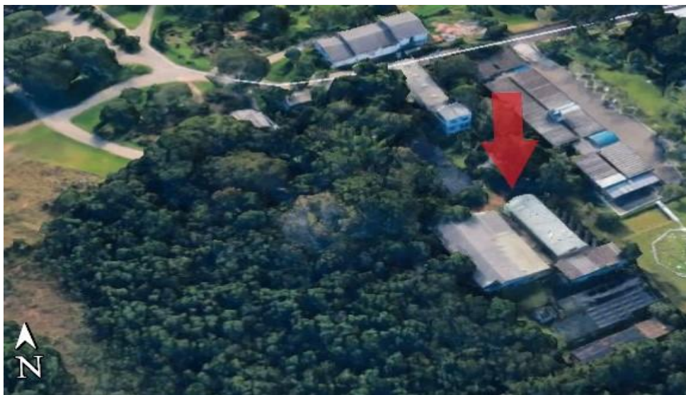
Figura 1 - Vista do Jardim Botânico de Porto Alegre, destacando o Banco de Sementes