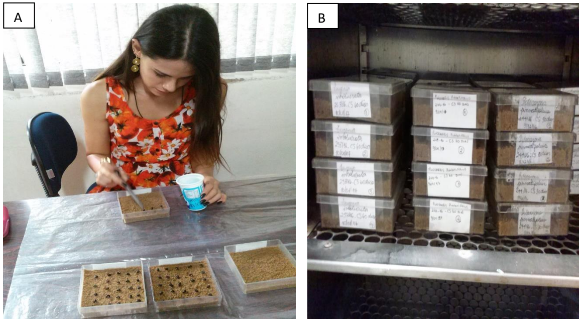
Figuras 7 – Preparo do teste de germinação (A) e caixas gerbox no germinador(B) no laboratório de sementes do Jardim Botânico. Porto Alegre (RS), 2018