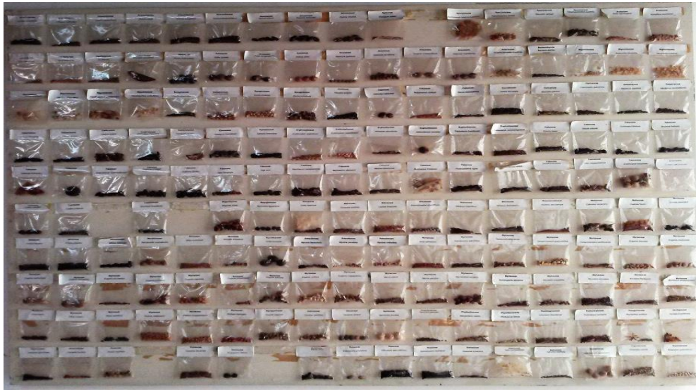
Figura 2 - Mostruário das sementes nativas do Banco de sementes do Jardim Botânico. Porto Alegre, (RS),2018

descrições morfológicas, considerando aspectos da testa e do endosperma e características do embrião. Além de pesquisas visando à obtenção de novas informações, este setor, tem como função o beneficiamento e processamento de lotes de sementes para garantir a produção de mudas no viveiro.