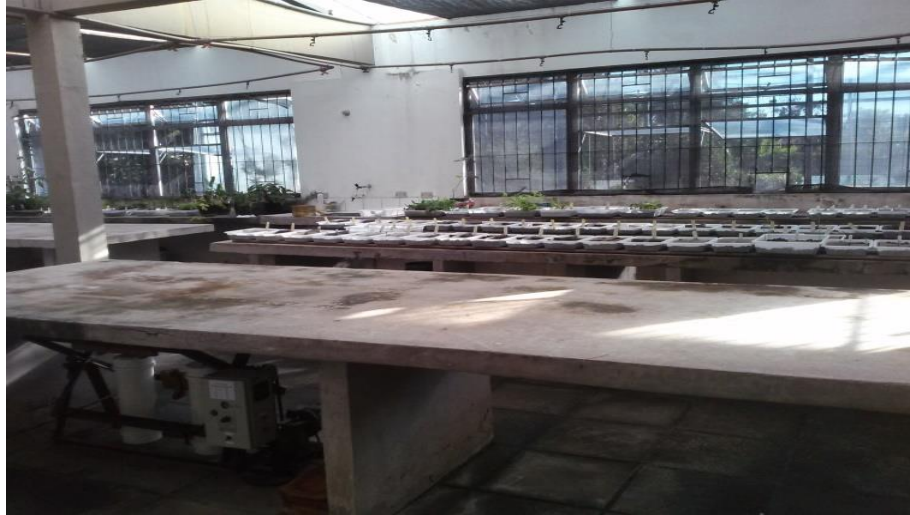
Figura 4 – Estrutura Casa de Vegetação