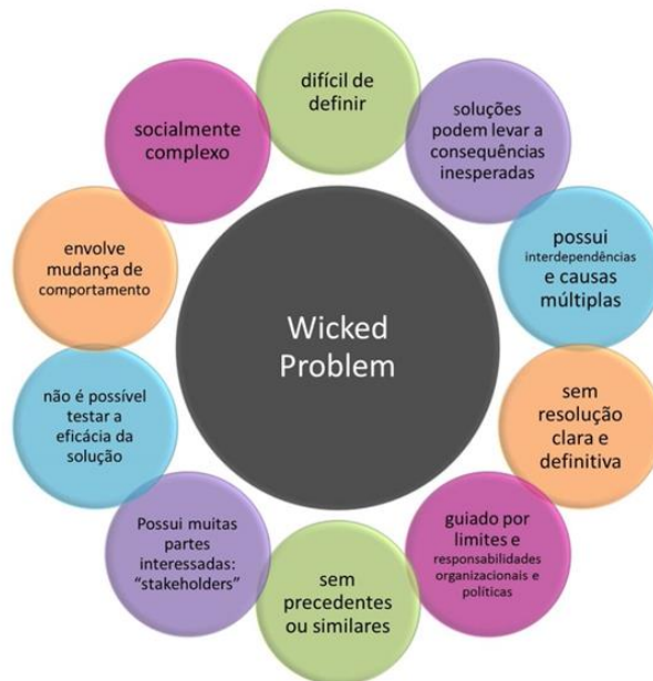
Figura 2 - Aspectos dos wickedproblems.

Para Conklin (2001), o melhor modo de entender a natureza wicked de um problema é justamente compreendê-lo em oposição às características de um tamed problem, que descreve como um problema relativamente estável, com um ponto-de-chegada, ou seja, quando a solução é alcançada, e ela ainda pode ser avaliada como certa ou errada, testada ou abandonada. Coyne (2004) entende os wicked problems como problemas persistentes, vagamente formulados e sujeitos a redefinições e diferentes resoluções ao longo do tempo e, em contrapartida, caracteriza os tamed problems como bem-definidos, com um único objetivo e com um conjunto de regras também bem-definidas.