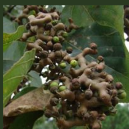
Hovenia dulcis (uva-do-japão)

O enfrentamento formal da presença de espécies exóticas invasoras no RS teve início com a publicação da Portaria SEMA n° 79 em 2013, que reconhece a lista das espécies invasoras no Estado. Porém, ainda não foram implementados procedimentos para a prevenção e controle no âmbito do licenciamento ambiental.