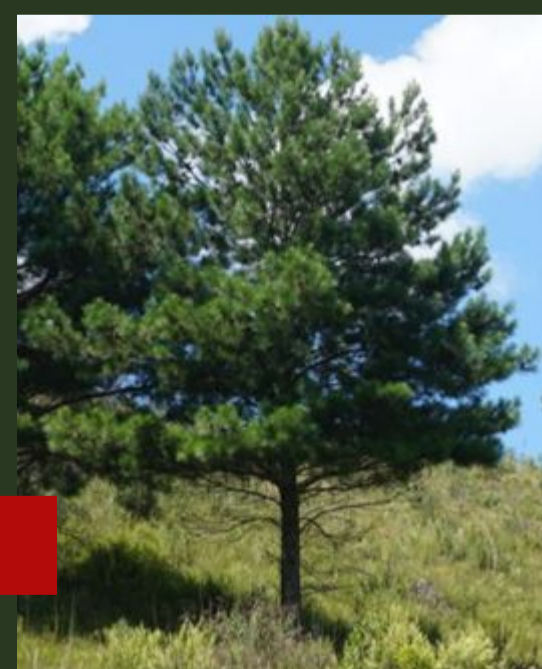
Pinus spp. (pinheiro)