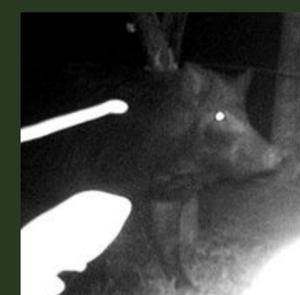
Sus scrofa (javali)