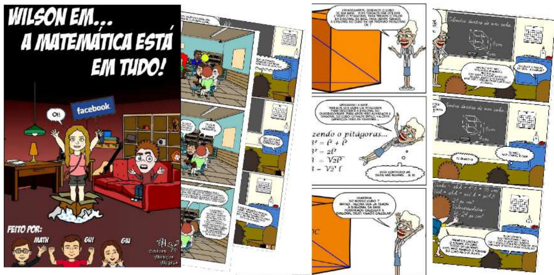
Figura 3 - Gibi de Matemática com 3 volumes - Bitstrips .

Todas os gibis construídos foram postados no grupo fechado no Facebook , denominado I201 - Informática, pelos estudantes e por eles discutidos os conceitos de matemática a serem explorados em cada história, assim como as tematizações escolhidas por cada trio ao criar sua história. A ação da professora de matemática foi sempre de perguntar os motivos e justificativas para cada ação, por exemplo, como no gibi selecionado para analisar com mais detalhes neste artigo a seguir: Por que é importante estudar a diagonal do cubo? Por que vocês apontam este assunto? entre outras questões. Além, da exploração curiosa de solicitar os motivos da escolha de um recurso como Memebase ao invés do HagáQuê no âmbito da matemática. O objetivo deste artigo não é discutir estas questões, mas discutir sobre a atividade em si.