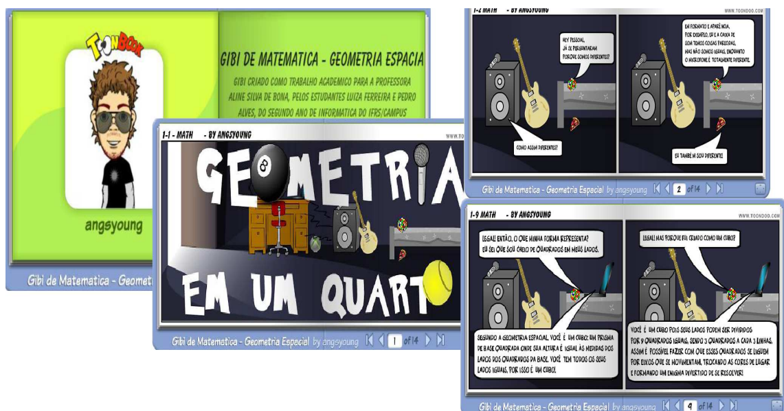
Figura 2 - Gibi de Matemática no meu Quarto com tema da Música - Tumblr .