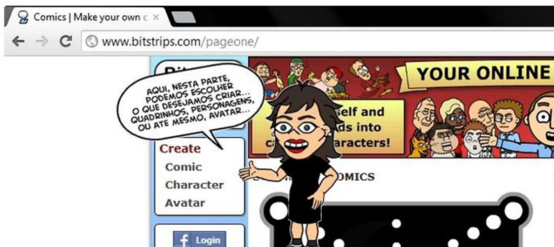
Figura 4 - Explicação dos estudantes sobre como usar o recurso digital escolhido.

A figura 4 a seguir mostra o tutorial criado pelo trio de estudantes que construíram o gibi da figura 3. Este tutorial foi uma atividade criada pelos próprios estudantes com a finalidade de que todos aprendam diferentes recursos digitais.