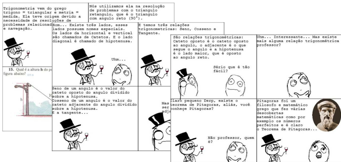
Figura 1 - Gibi Digital sobre a Trigonometria na Geometria Espacial - Meme .

A questão proposta aos estudantes com esta atividade foi: Construir um gibi que explique o que aprendeu de geometria espacial de forma livre e criativa. Como dito na introdução por iniciativa de um estudante a atividade passou a ser em trios e com recursos digitais diversos como exemplos, os mais usados: Tumblr , Memebase , Twitter , Bitstrips , aplicativos do Facebook , e vídeos feitos em versão animada postados no YouTube . A seguir, as figuras 1, 2 e 3 exemplificam o layout dos gibis digitais construídos respectivamente, no Memebase , Tumblr , e Bitstrips .